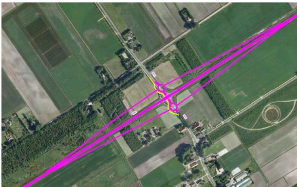
Figuur 4. Ontwerp kruising N391 – Roswinkelstraat aangegeven met magenta lijn.