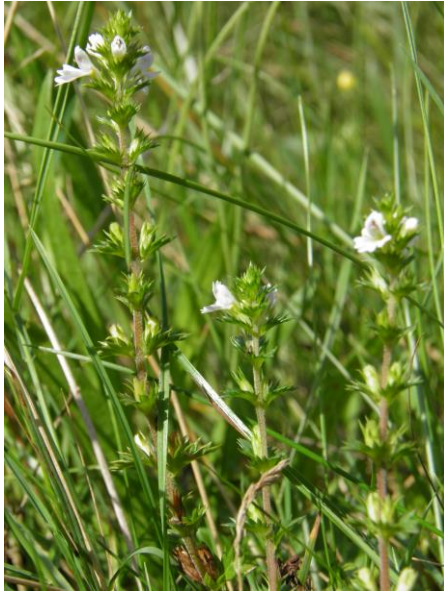
Figuur 10. Enkele groeiplaatsen van Stijve Ogentroost bevinden zich langs de N391/N366.