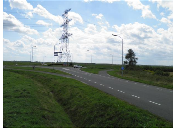
Figuur 7. De Pottendijk wordt in een later stadium aangepast.