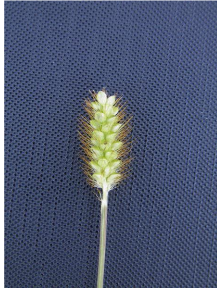
Figuur 11. Geelrode Naalbaar is aangetroffen langs het fietspad bij de Emmerweg, Emmen.