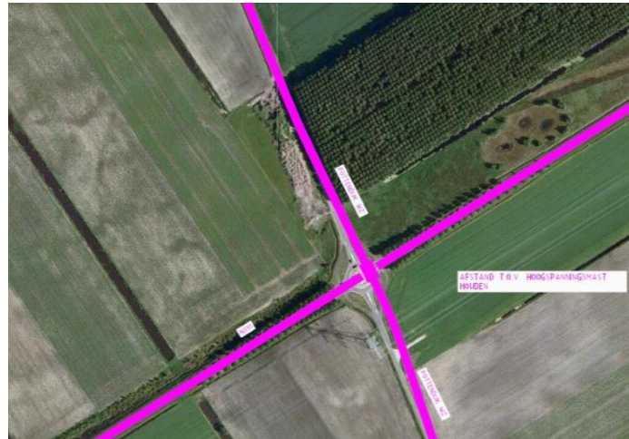
Figuur 3. Ontwerp kruising N391 – Pottendijk aangegeven met magenta lijn.