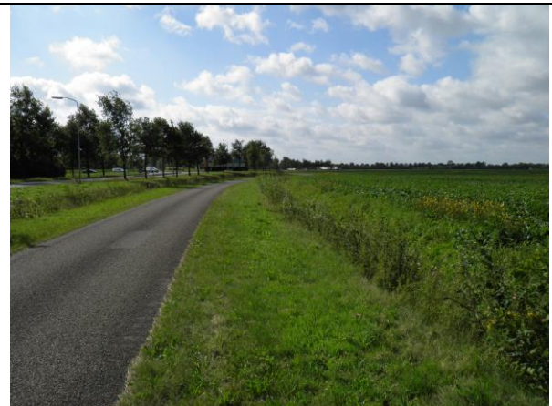
Figuur 9. Bij de kruising N391/N366 wordt een lus door het agrarische perceel aangelegd.