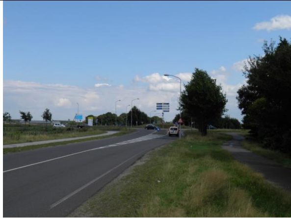
Figuur 6. De Emmerweg zal middels een dubbele op-/afrit verbonden worden met de N391.