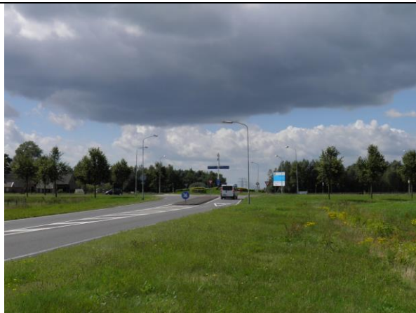
Figuur 8. De rotonde N391/N379 wordt vervangen door een tweetal gescheiden rotondes.