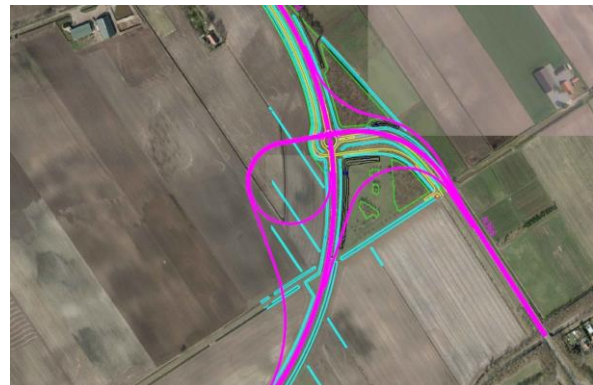
Figuur 5. Ontwerp kruising N391 – A. G. Wildervanckweg/N366 aangegeven met magenta lijn.