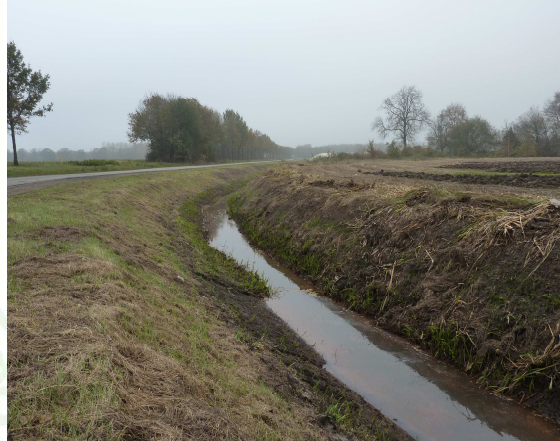
Figuur 2.2 Een in het plangebied aanwezige sloot.