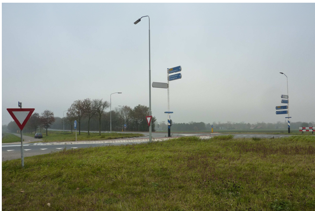
Figuur 1.2 Impressie van het plangebied.

Het plangebied is gelegen in open agrarisch landschap. Aan de oostkant van de A.G. Wildervanckweg ligt een bedrijventerrein. Parallel aan de N366 ligt een B-weg, de Boswijklaan. Daarnaast loopt een watervoerende sloot, evenals langs de westzijde van de N366 en links en rechts langs de A.G. Wildervanckweg. Verder zijn in de brede berm van de N366 bomen aangeplant. Ter hoogte van het kruispunt gaat het om losstaande jonge eiken, meer ten