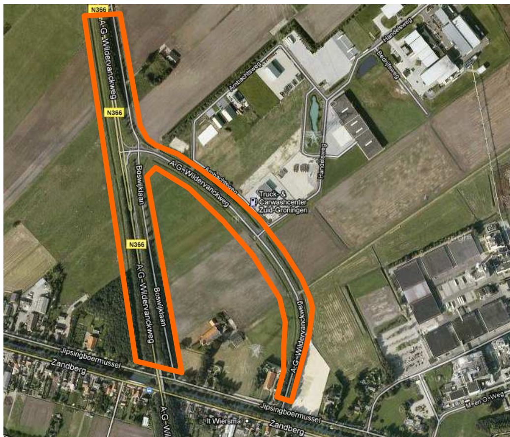
Figuur 1.1 De ligging van het plangebied (Bron: Google Earth Pro).