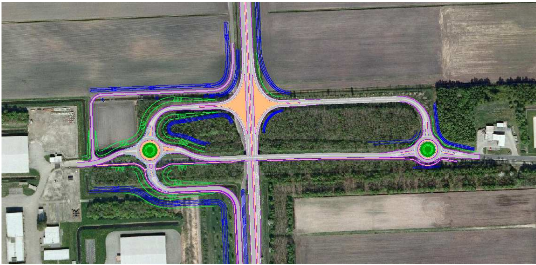
Figuur 3. Toekomstige situatie; ligging/verlegging wegen en fietspaden (roze lijnen), ligging/verlegging greppels (blauw) en wegbermen (groen).