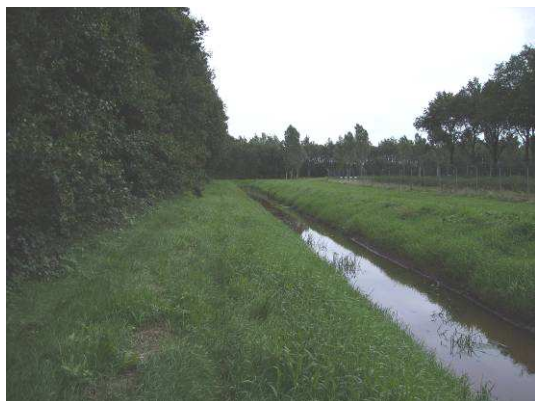
Huidige watergang aan de westzijde van de Nulweg