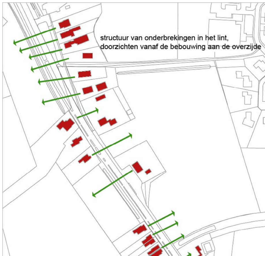
Figuur 1. Voorbeeld van een open lintstructuur

In figuur 1 is zichtbaar dat de onderbrekingen en doorzichten bepalend zijn voor de structuur van het dorp en dus voor de identiteit van het dorp. In dit geval zal er veel waarde aan de open ruimten gehecht moeten worden.