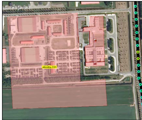
geprojecteerde situatie en hoogste groepsrisico

Voor de verantwoording van het groepsrisico is een advies van Regionale Brandweer nodig met betrekking tot rampenbestrijding en zelfredzaamheid. Met name dit laatste aspect is belangrijk aangezien hier personen verblijven die verminderd zelfredzaam zijn.