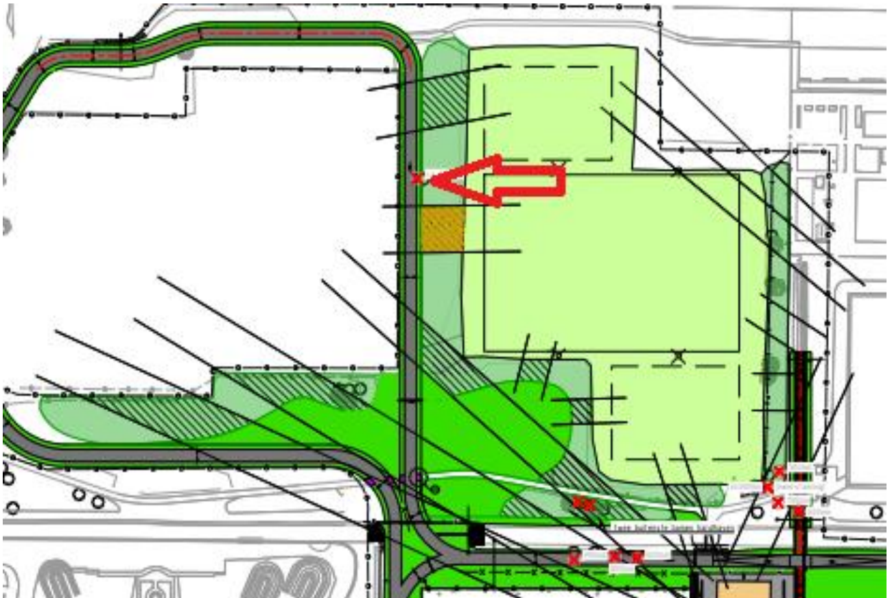
Afbeelding 2.1: Weergave (met een rode pijl) van de te kappen boom die vanaf enige afstand is beoordeeld.

Voor wat betreft de te kappen bomen zijn geen jaarrond beschermde nesten aangetroffen. Tevens zijn geen holtes aanwezig die potentieel geschikt kunnen zijn als rust- en verblijfplaats voor vleermuizen. Eén boom was niet van dichtbij te inspecteren wegens een afgesloten hek (afbeelding 2.1).