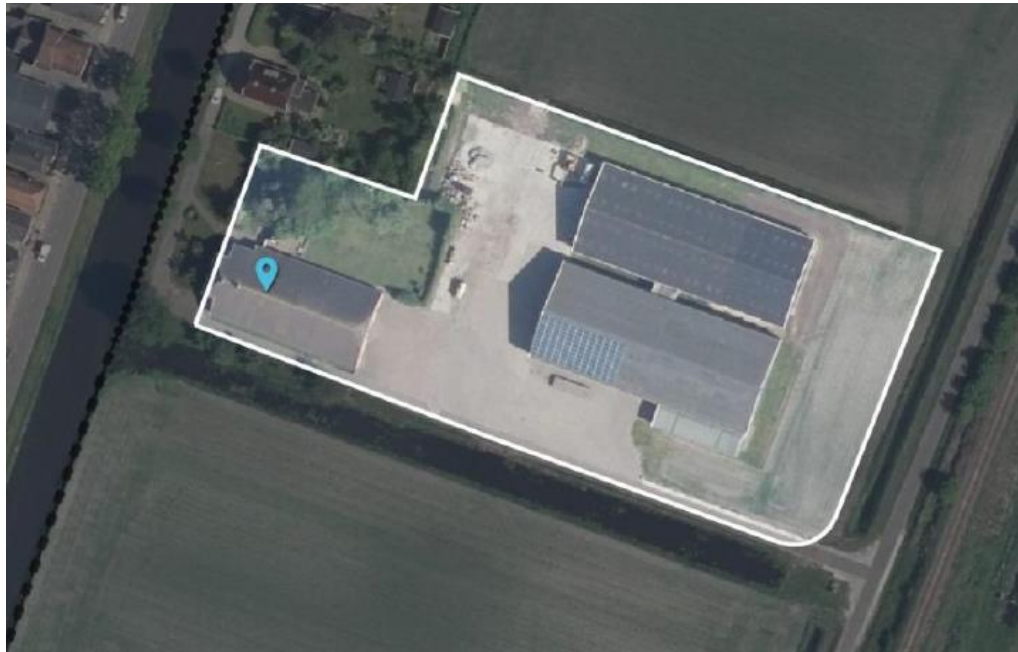
Figuur 4. Toegekend bouwvlak

De uitbreiding van initiatiefnemer past niet binnen de regels van het bestemmingsplan. De bewaring zal buiten het bouwvlak worden gebouwd en een goothoogte hebben van 6 meter. Op grond van de bouwregels dienen gebouwen binnen het bouwvlak gebouwd te worden. Tevens mag de goothoogte maximaal 5 meter bedragen. Middels een afwijkingsbevoegdheid kan de goothoogte worden verhoogd tot 6 meter.