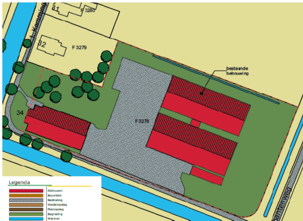
Figuur 2. Huidige situatie