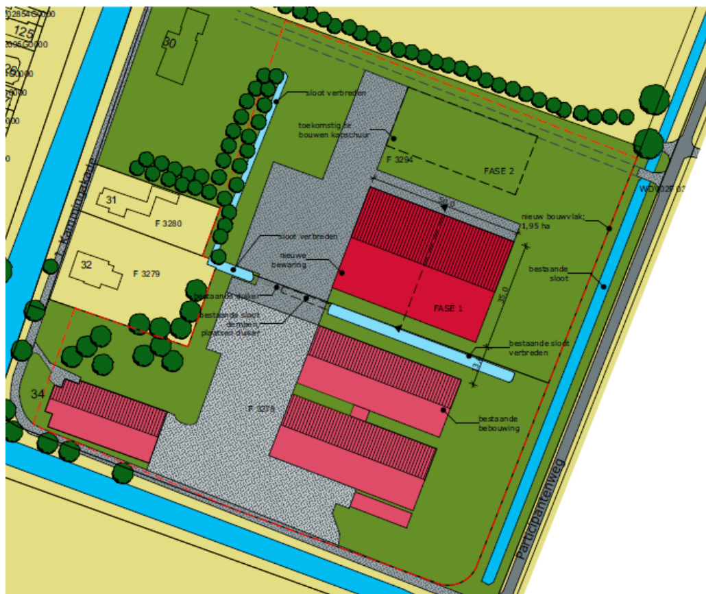
Figuur 6. Locatie watercompensatie

Het akkerbouwbedrijf van initiatiefnemer wordt uitgebreid met een bewaarschuur en oppervlakteverharding van totaal 4030 m 2 . Dit wordt gecompenseerd door de bestaande sloot die tussen de huidige bebouwing en de nieuwe bebouwing ligt te verbreden, samen met de sloot en westen van het perceel. Op deze manier blijft de openheid geborgd en wordt de nadruk op de kavelstructuur gelegd.