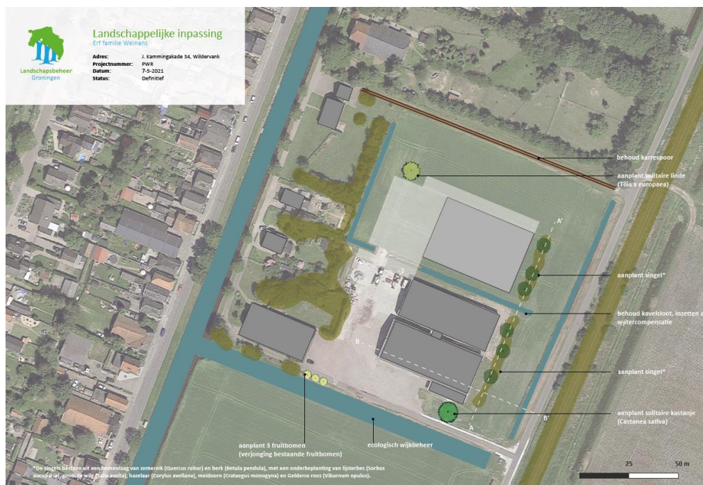
Figuur 5. Uitsnede erfinrichtingsplan

In het erfinrichtingsplan zijn bovenstaande aspecten behandeld. Het gehele erfinrichtingsplan is opgenomen als bijlage bij deze toelichting.