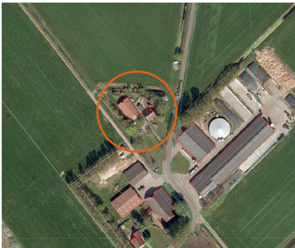
figuur 1: Ligging plangebied

Momenteel is aan de Dalweg 12 een kleinschalige kinderopvang, in de vorm van een gastouderopvang, gevestigd. Het perceel heeft de bestemming Agrarisch, overeenkomstig de agrarische hoofdactiviteit. De bewoner wil graag het aantal kindplaatsen uitbreiden tot maximaal 10 kinderen, waardoor de opvang onder "kindercentrum" komt te vallen. Het voorgestelde initiatief past niet binnen de bestemming Agrarisch. Binnen de bestemming Agrarisch is het mogelijk een nevenactiviteit toe te voegen via een wijzigingsbevoegdheid in het bestemmingsplan.