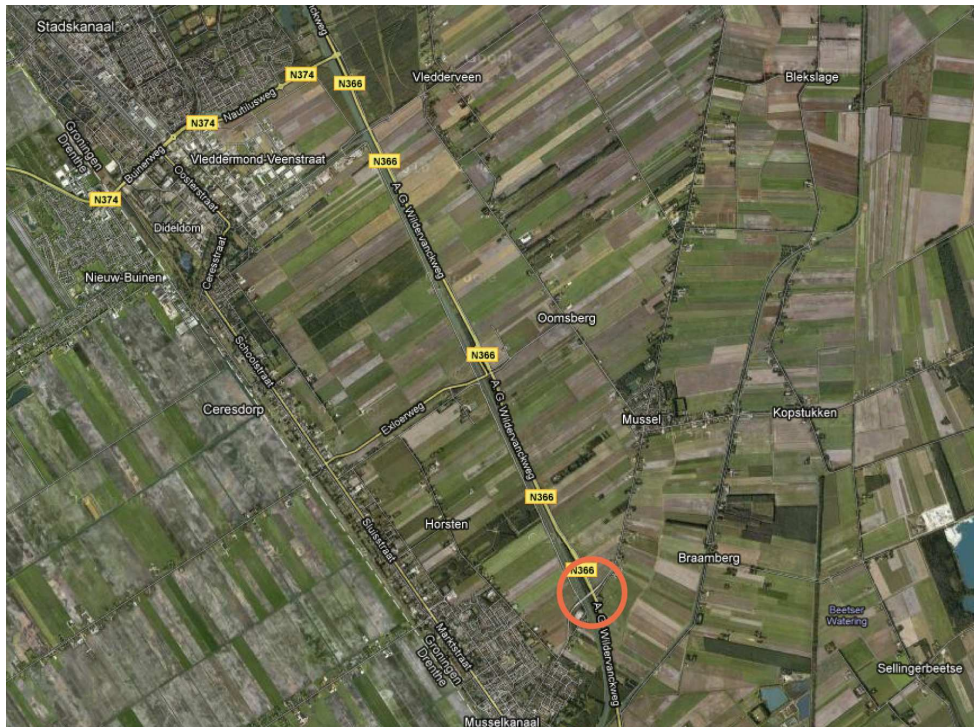
Figuur 1: Ligging plangebied

Het voor u liggende ruimtelijke onderbouwing ten behoeve van de omgevingsvergunning voor het uitvoeren van een werk, gaat in op de aanleg van een ongelijkvloerse kruising van de N366 en de Kruisstraat. Om deze aanpassing mogelijke te maken is een wijziging van het bestemmingsplan nodig. In het bestemmingsplan Landelijk gebied heeft het betreffende perceel, waar de oprit richting Veendam gepland staat, de bestemming Agrarisch. Dit houdt in dat voor een gedeelte van het betreffende perceel de bestemming Verkeer zal moeten krijgen. Middels deze ruimtelijke onderbouwing wordt een planologische mogelijkheid gecreëerd om de aanpassing van de N366 te kunnen realiseren.