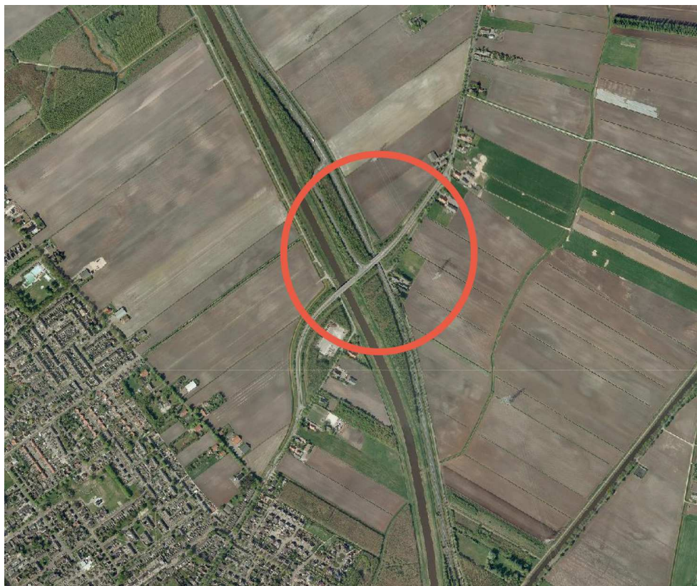
Figuur 2: Kruising Kruisstraat - N366

Opwaarderen van de gehele route, en het stimuleren daarvan, mede als alternatief voor de steeds drukker wordende N34 is daarom dringend gewenst. In 2004 hebben de provincies Groningen en Drenthe en de belanghebbende gemeentes een studie naar die verbetering uitgevoerd. In die studie naar het eindbeeld van de route N366 - N391 - rondweg Emmen - N34 is geconcludeerd dat de route moet worden opgewaarderd tot een hoogwaardige stroomweg waarbij de aansluitingen met het onderliggende wegennet ongelijkvloers zijn uitgevoerd, de weg is verbreed naar 8,60m en het weggedeelte Veendam - Pekela is verdubbeld. Het ongelijkvloers maken van de aansluiting met de Kruisstraat is een van de vele maatregelen op de N366.