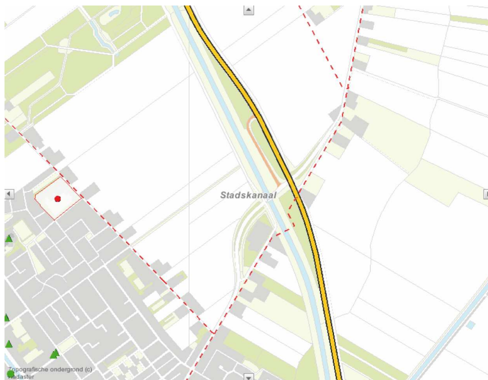
Figuur 5: De ligging van de gasbuisleiding nabij het plangebied

Aangezien de beoogde op-/afrit aansluit op N975 (Musselkanaal-Onstwedde) moet er op basis van het Provinciaal Basisnet (20-04-2010) een 30-meterzone aan weerszijden van de op-/afrit (vanaf de rand van de weg) worden gehanteerd, waarbinnen geen nieuwe objecten ten behoeve van minder zelfredzame personen geprojecteerd mogen worden.