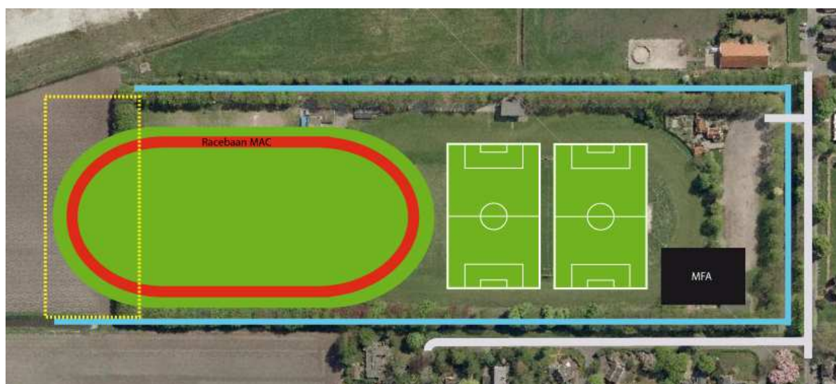
Figuur 2: Toekomstige situatie indicatief

De SPW krijgt een nieuw onderkomen in het nieuw op te richten MFA aan de voorzijde van het sportterrein. Hierdoor worden de voetbalvelden en de racebaan verlegd, zodat de voetbalvelden aan het MFA liggen. Door deze wijziging is 75 meter extra grond nodig om de racebaan van de MAC te kunnen plaatsen.