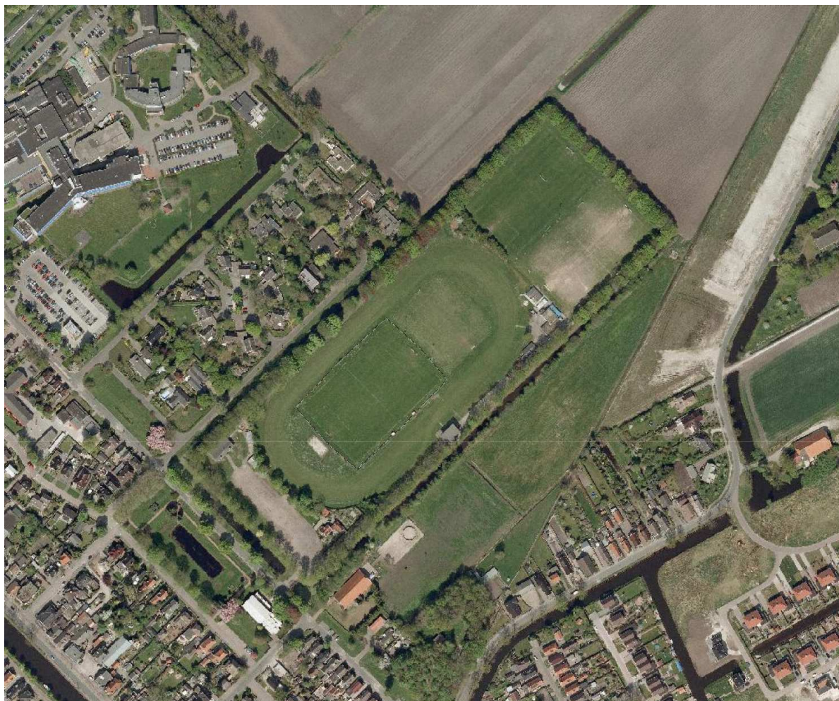
Figuur 1: Luchtfoto van het sportterrein

De SPW en MAC zijn momenteel gevestigd op het sportpark aan de Berkenstraat in Stadskanaal. Aan de voorzijde van deze sportpark zijn plannen in vergevorderd stadium voor de vestiging van een Multifunctionele accommodatie (MFA). Hierdoor komt de voetbalvereniging SPW op het terrein waar momenteel de MAC gevestigd is. De MAC verhuist naar de achterzijde van het sportterrein. Door de herindelings is aan de achterzijde van het sportpark tot 75 meter vanaf de sloot grond aangekocht. De aangekochte grond heeft momenteel de bestemming "Agrarisch". De activiteiten van de MAC past niet binnen deze bestemming. Om dit alsnog mogelijk te maken is de voorliggende omgevingsvergunning opgesteld.