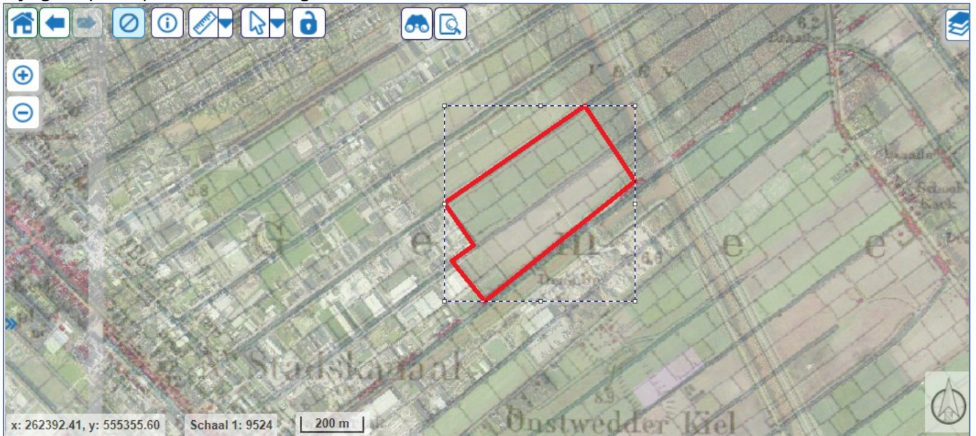
Figuur 1 luchtfoto met onderliggend een topografische kaart uit 1915