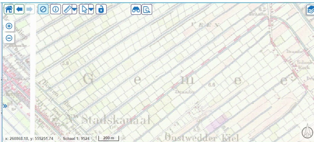
Figuur 2 Vleddermond in 1915