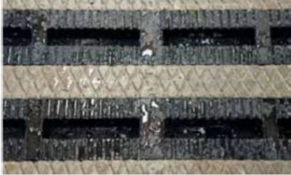
Bijlage 1: Foto's en detailtekeningen roostervloer voorzien van afdichtingcassettes in de roosterspleten