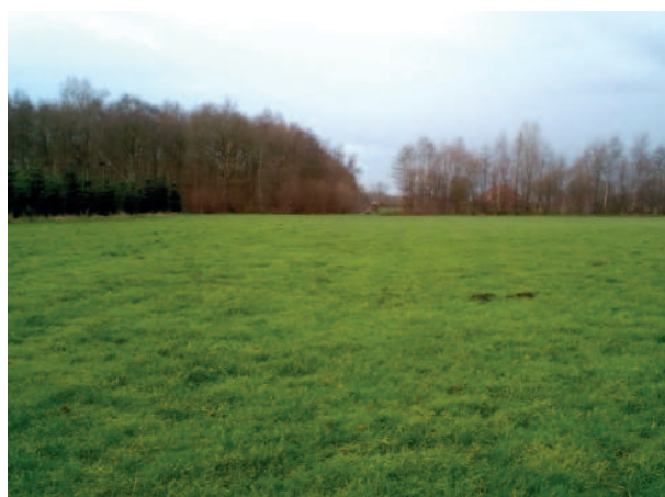
Figuur 6. Het grasland tussen de kerstbomen en de sloot