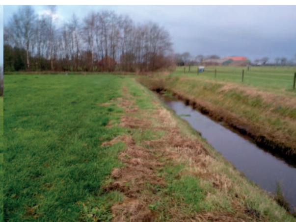
Figuur 7. De waterschaps sloot aan de noordzijde