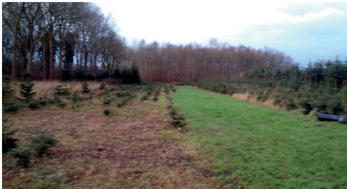
Figuur 2. Het betreffende perceel met kerstbomen