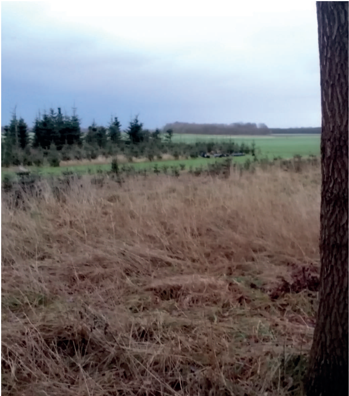
Figuur 1. Vanaf de Streekweg kijkende richting het noorden - open landschap