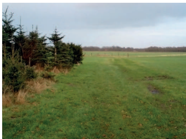
Figuur 4. Het wijdse uitzicht vanaf de Streekweg

Op zaterdag 20 december is er een bezoek gebracht aan het plangebied. Dhr. Hilverts heeft een toelichting op het plan(gebied) gegeven. De aanwezige beplanting is geïnventariseerd, en de wensen van de fam. Hilverts zijn besproken. Onderstaand een impressie van het perceel.