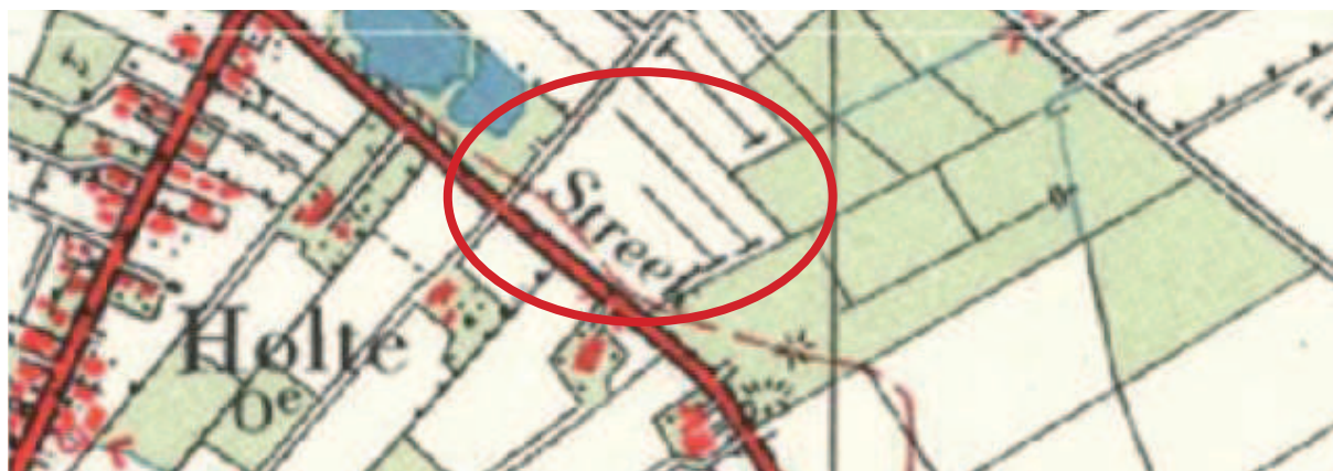
Figuur 9. Historische kaart 1960