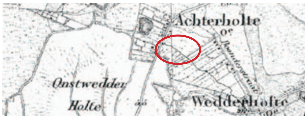
Figuur 8. Historische kaart 1850

Kenmerkend voor de Streekweg/ Boendersstraat is dat de bebouwing alleen aan de zuidzijde van de weg is gelegen. Aan de noordzijde is het veen pas later ontgonnen en hier is geen bebouwing geplaatst. Het plan heeft slechts een zeer beperkte invloed op het gebied. De verkaveling blijft ongewijzigd. De kerstbomen-kwekerij verdwijnt en er worden standplaatsen ingericht. Doordat er geen bebouwing aan de noordzijde wordt toegestaan, blijft de bebouwingsstructuur gehandhaafd.