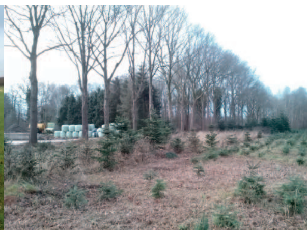
Figuur 5. Het perceel met daarop de kerstbomen