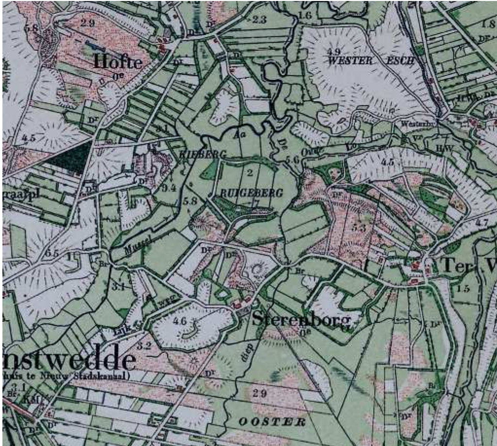
Figuur b. Fragment kadastrale kaart 1935

De grillige verkaveling wordt op vele plaatsen versterkt en beter zichtbaar gemaakt, door beplanting op de perceelsgrenzen. Hierdoor is een coulisselandschap ontstaan. Dit is een halfopen landschap dat door de beplanting en bebouwing het karakter van een toneel met coulissen heeft. De beplantingen bestaan vooral uit houtwallen en heggen.