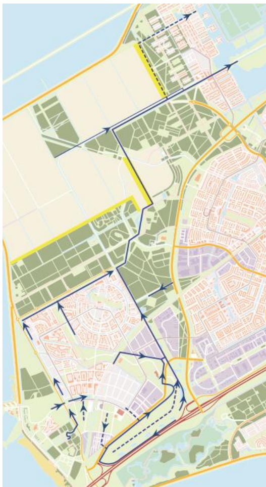
Figuur 2: Waterstructuur zoals dat gepland is voor 2030. In licht blauw wordt het bestaande water aangegeven. In donkerblauw de gewenste stromingsrichting in de toekomstige situatie. Gestippeld de mogelijk aan te leggen watergangen.