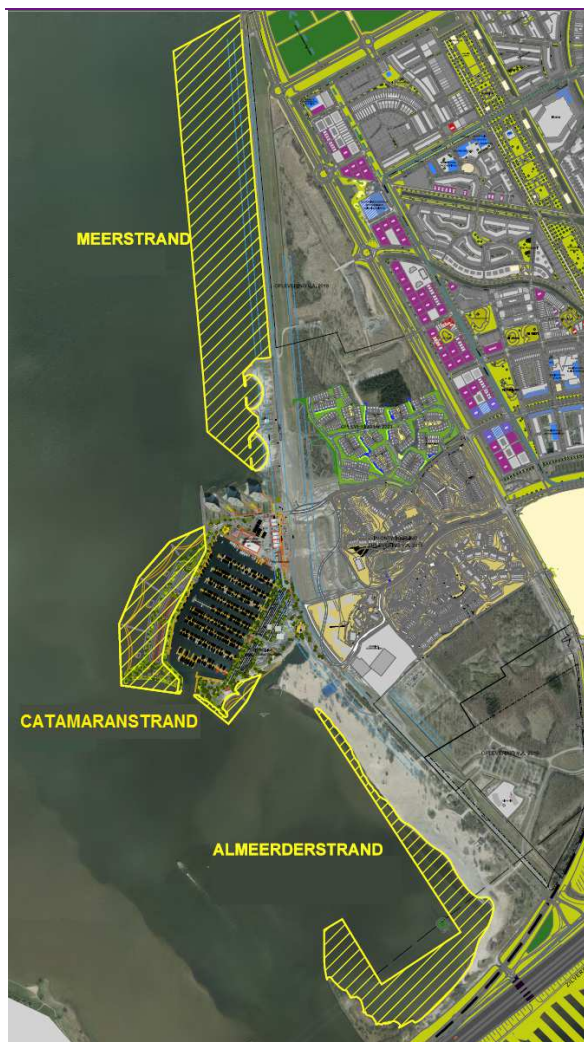
Figuur 1.2 De stranden in de bestemmingsplannen Almere Poort