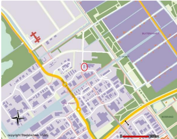
Figuur: ligging van vetsmelterij Bosland (rood omcirkeld).

1. In het plangebied ligt Vetsmelterij Sonac, Bolderweg 40.