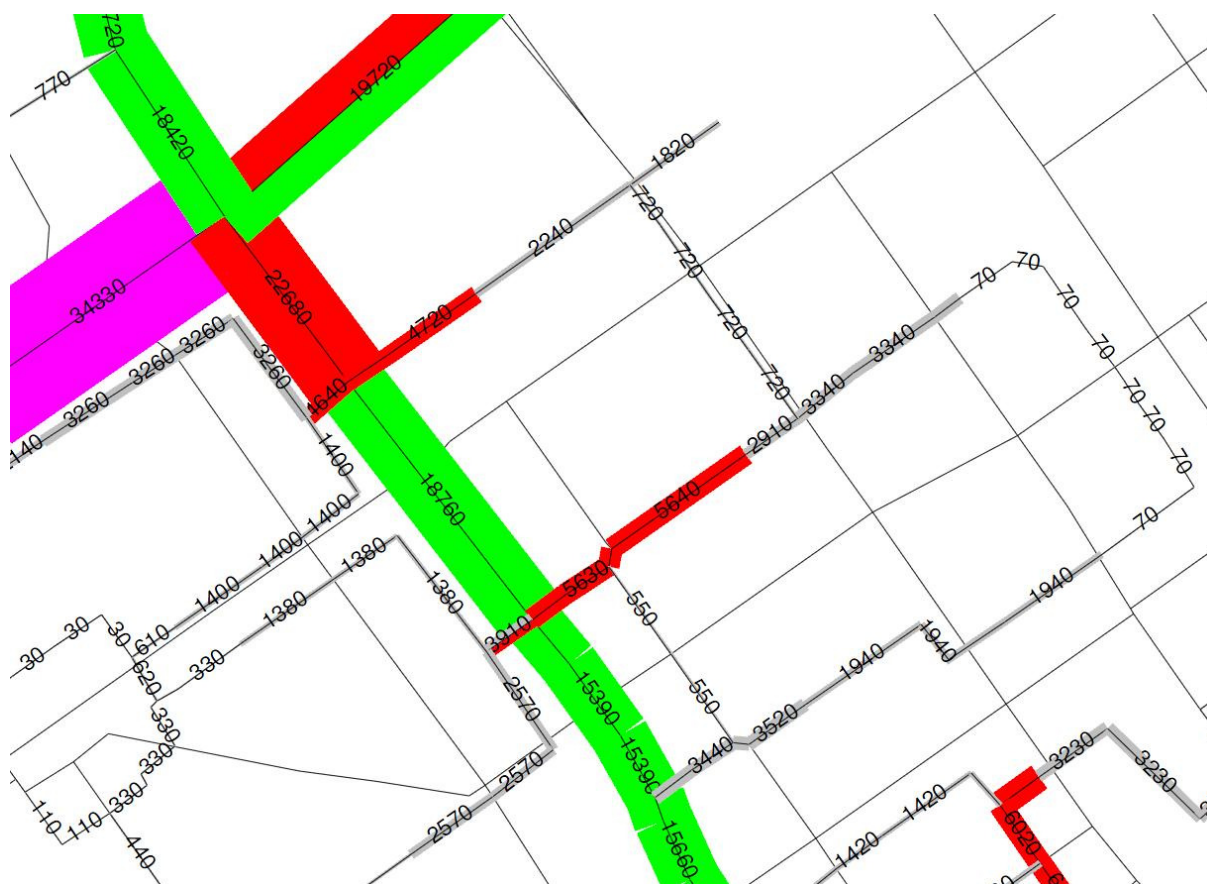
situatie 2020 met nieuw bestemmingsplan