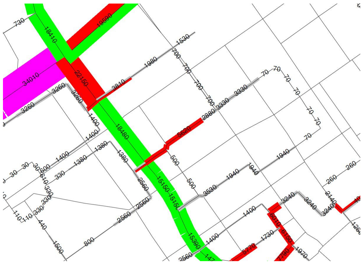
situatie 2020 met huidig bestemmingsplan