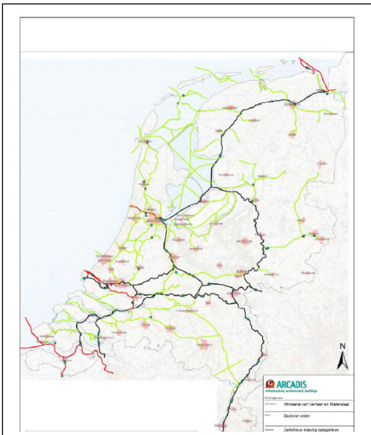
Figuur 1: Kaart Basisnet Water.