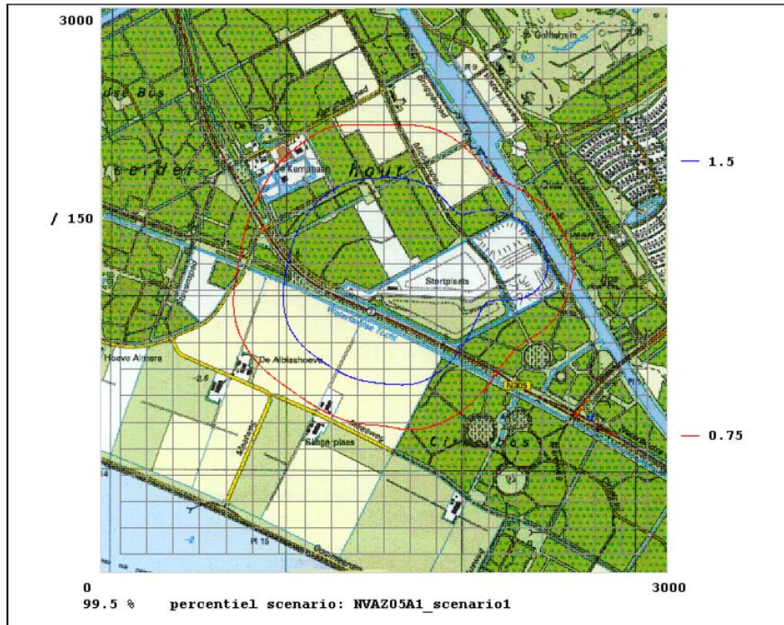
Figuur a Geurcontour van 0,75 en 1,5 \text{ge}/\text{m}^3 als 99,5-percentielwaarde als gevolg van stortplaats Braambergen te Almere in de huidige situatie (situatie 1) (het rekengebied is 3.000 x 3.000 m, het gepresenteerde gebied is 7% groter dan het rekengebied; 1 gridveld is 150 . 150 m)

Hieronder is de geurcontour van 0,75 (rood) en 1,5 \text{ge}/\text{m}^3 (blauw) als 99,5 percentiel weergegeven.