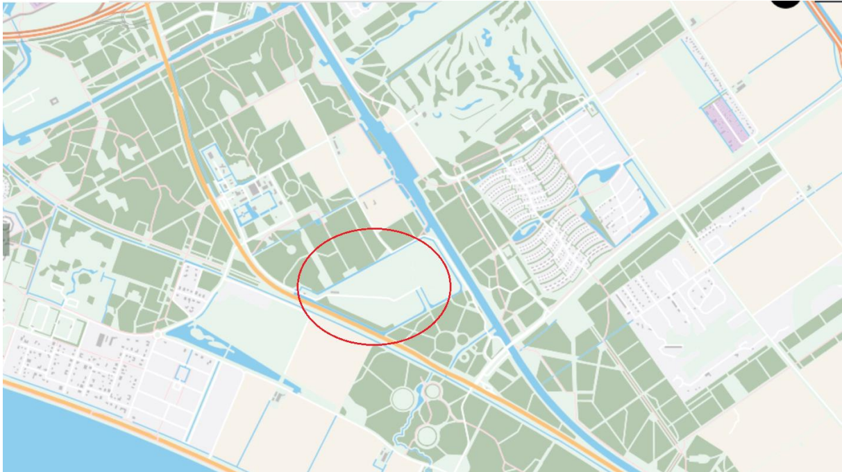
Figuur: Ligging van Stortplaats Braambergen (rood omcirkeld).

In het plangebied ligt Stortplaats Braambergen.