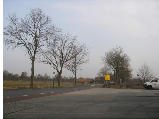
Figuur 2: Impressie van het plangebied.