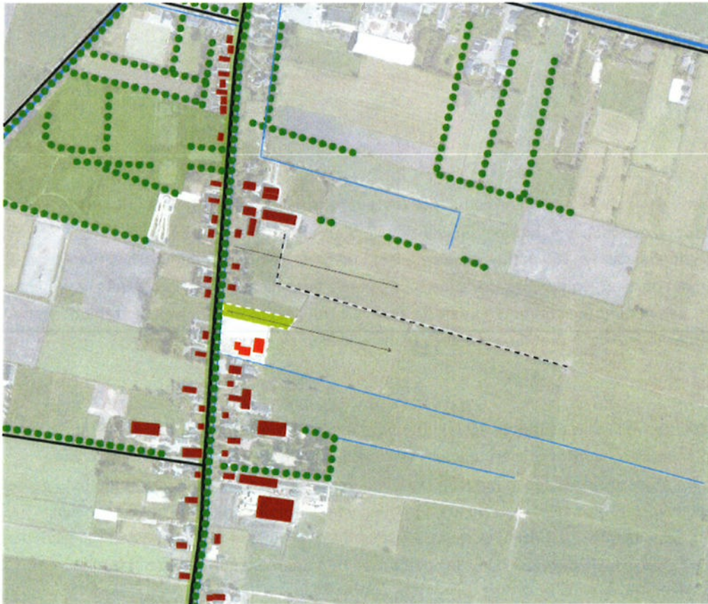
Afbeelding locatie langs de Oudestreek Zevenhuizen, aangegeven met witte omlijning. Nieuw aangekochte gronden in groen.

In het schetsontwerp is rekening gehouden met de landschappelijke context van de locatie: het veenweidegebied. Dit gebied kenmerkt zich door de opstreckende verkaveling dwars op het kanaal / lint en open zichten richting de weilanden. Langs het lint van de Oudestreek bevinden zich diverse erven, welke richting de kern van Zevenhuizen steeds dichter naast elkaar gesitueerd zijn. Het groene en landelijke doorzicht ter hoogte van de parkeerplaats is daarom waardevol.