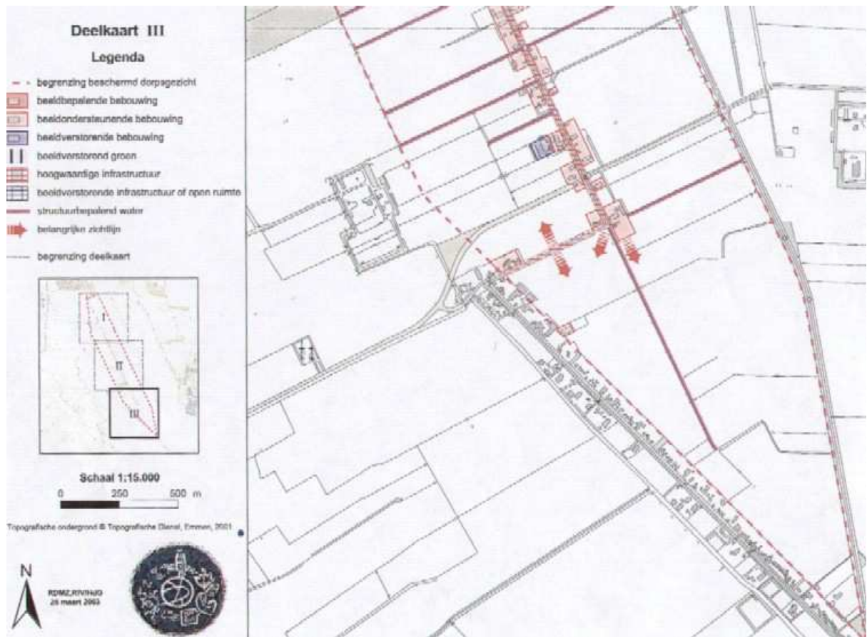
Typeringen beschermd dorpsgezicht, 'Windeweer Zuid'