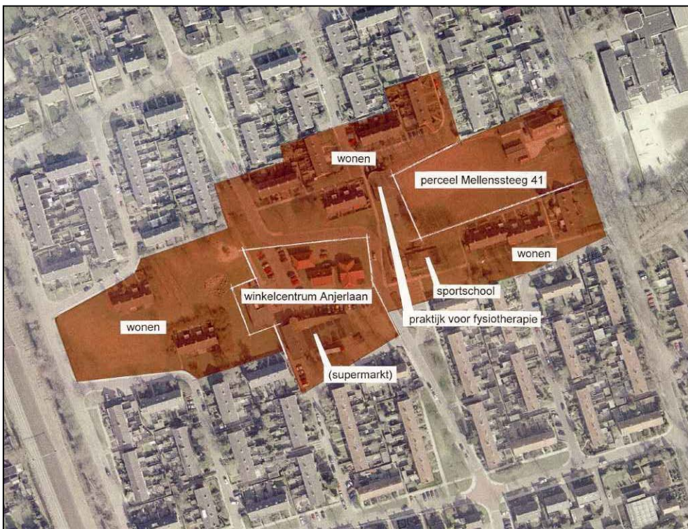
Figuur 3. Huidige situatie: functionele structuur

Gelet op het toenemende aandeel ouderen in de wijk Oosterhaar (24% van de 5400 inwoners van de wijk is 55 jaar of ouder) is het wenselijk om het - nu nog zeer beperkte - aanbod aan seniorenwoningen in de wijk te vergroten. Dit geldt ook voor het aanbod aan zorg- en medische voorzieningen in de wijk; het aanbod bestaat op dit moment uitsluitend uit een tandarts en een praktijk voor fysiotherapie. Andere zorgvoorzieningen zoals een huisarts of een apotheek ontbreken.