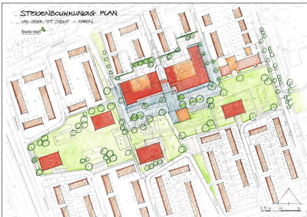
Figuur 4. Stedenbouwkundig plan Spoor tot Steeg (concept 2006)

Boven de winkels worden in maximaal drie bouwlagen woonappartementen gerealiseerd. Parkeergelegenheid en bergingen voor deze woningen worden gesitueerd in een parkeerkelder onder het winkelcomplex.