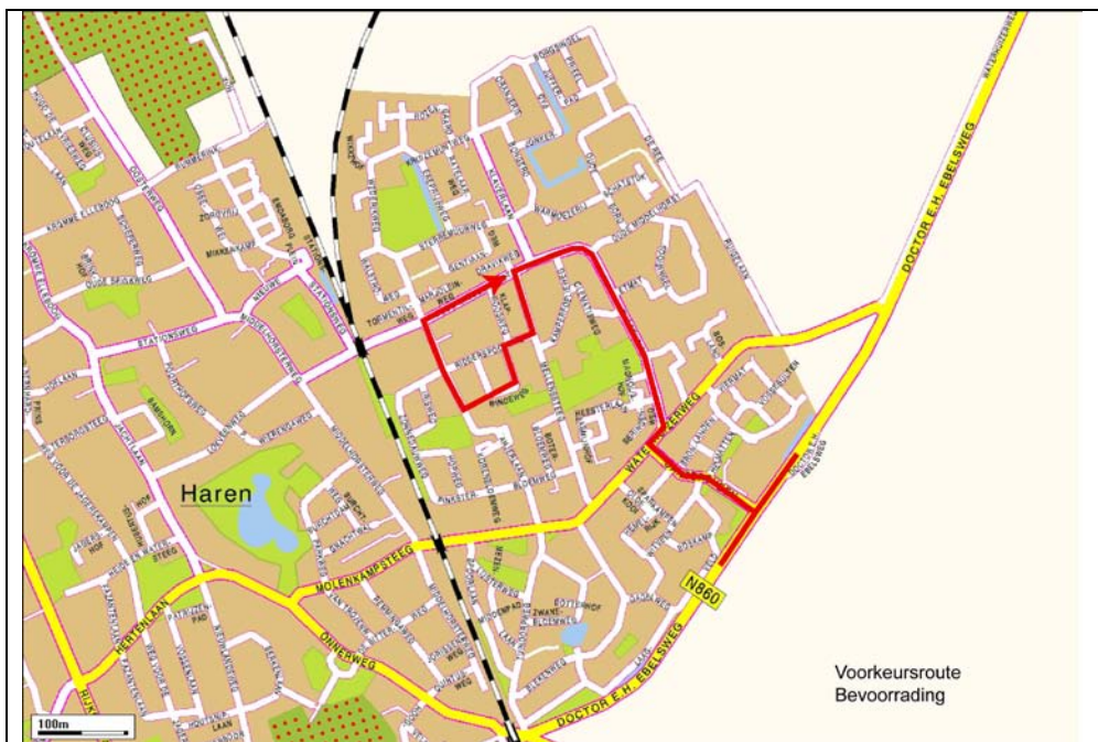
Figuur 5. Verkeersplan

Ook zullen extra parkeervoorzieningen worden aangebracht aan de koppen van de Windeweg (oostelijk deel) zodat parkeren in de straat niet meer noodzakelijk is.