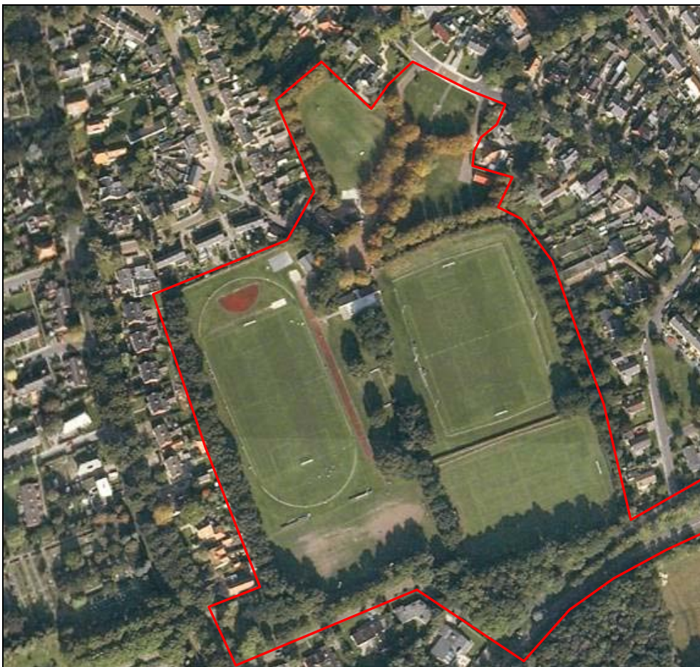
Figuur 3. Sportpark Onnerweg (huidige situatie)

Het sportpark aan de Onnerweg vormt de thuishaven voor twee sportverenigingen. Dit zijn atletiekvereniging ATC '75 en voetbalvereniging V.V. Haren. Zoals te zien is op de onderstaande luchtfoto, zijn er momenteel drie voetbalvelden aanwezig, waarbij rondom het westelijke voetbalveld een aantal sportvoorzieningen aanwezig is ten behoeve van atletiek.