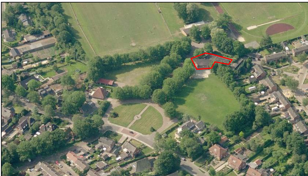
Figuur 4. Ligging entree, clubgebouw V.V. Haren en laan met bomen

Zoals gezegd is één van de gebouwen aan de noordzijde van het sportpark gedeeltelijk in gebruik als kinderdagverblijf (zie figuur 3).