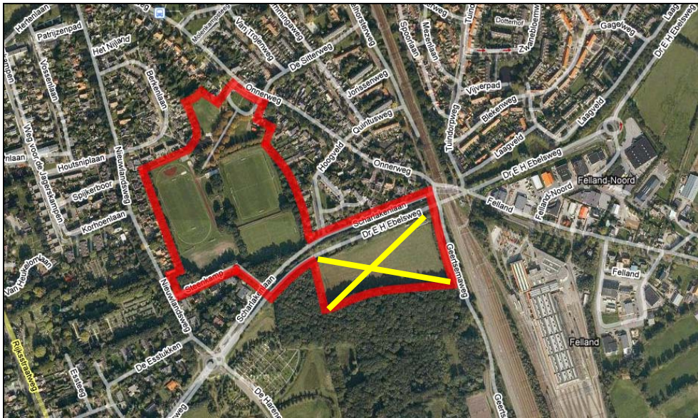
Figuur 2. De ligging van het plangebied