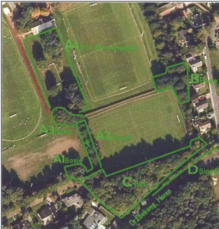
Figuur 5. Deelgebieden bomeninventarisatie

Geconcludeerd wordt, dat er in het plangebied geen sprake is van aanwezigheid van monumentale bomen. Wel moet een aantal waardevolle bomen wijken. Hierbij gaat het met name om de locatie van de aan te leggen parkeerplaats en om de beplanting langs de toekomstige buitengrenzen van de sportvelden. Als uitgangspunt geldt dat optimale overlevingskansen worden geboden voor de bomen die in stand worden gehouden. Hoewel een aantal bomen moet wijken, blijft de structuur van de beplanting vergelijkbaar met de oude situatie. Het verwijderen van een aantal bomen brengt geen schade toe aan de ecologische waarden, waarbij het landschappelijke beeld verbetert ten opzichte van de oude situatie.