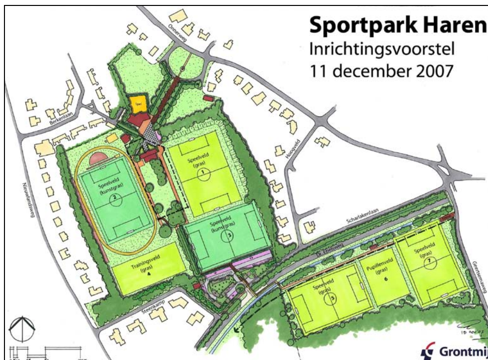
Figuur 6. Inrichtingsschets Sportpark Haren

Als totaalconcept voor het sportpark is een inrichtingsschets opgesteld. Dit is in de onderstaande figuur weergegeven.