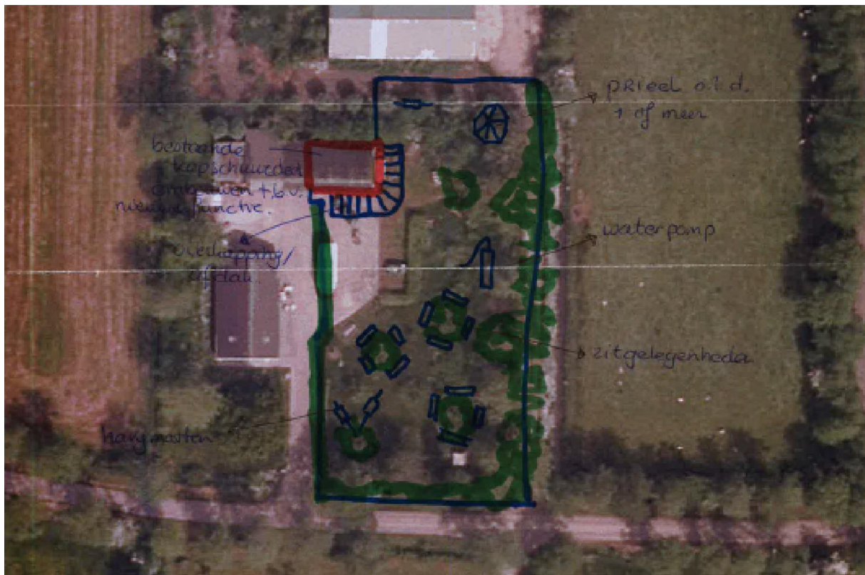
Figuur 3: Schets van de beoogde situatie

In figuur 3 is een schets van de beoogde situatie opgenomen.