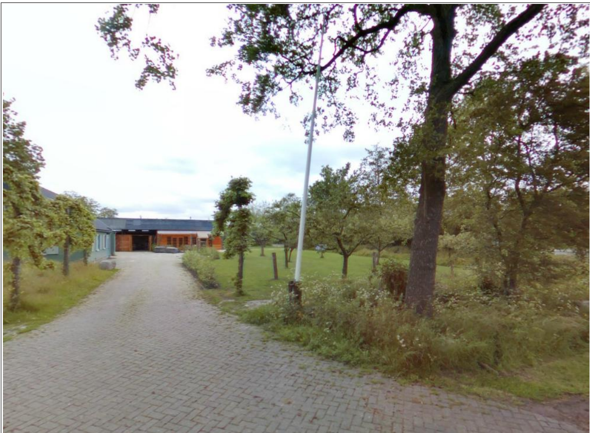
Figuur 4: Vooraanzicht van de planlocatie

Voor het uitoefenen van de theetuin worden de bestaande bebouwing en het bestaande erf gebruikt. Er vindt derhalve geen toename van bebouwing of uitbreiding van de locatie plaats. De theetuin 'plus' is zowel landschappelijk als ruimtelijk goed in te passen op het perceel.