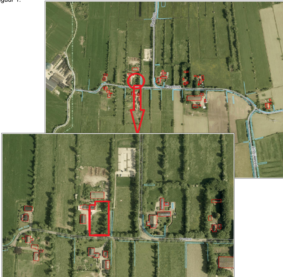
Figuur 1: Ligging van het plangebied

Het plangebied betreft een deel van het kadastrale perceel Gemeente Grootegast, sectie O, nummer 377 gelegen aan Peebos 1a te Opende. De globale ligging van het plangebied is weergegeven in figuur 1.