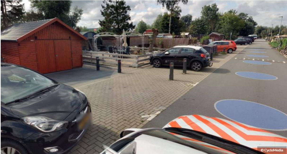
Figuur 3: Zicht vanaf de openbare weg op de projectlocatie met naast de projectlocatie gelegen het openbare pad

Als gevolg van de gekozen positionering zal er geen sprake zijn van een vermindering van het zicht op, en vanaf, de openbare rijbaan ten opzichte van het openbare pad (en vice versa). Van een aantasting van de verkeersveiligheid zal dan ook geen sprake zijn.