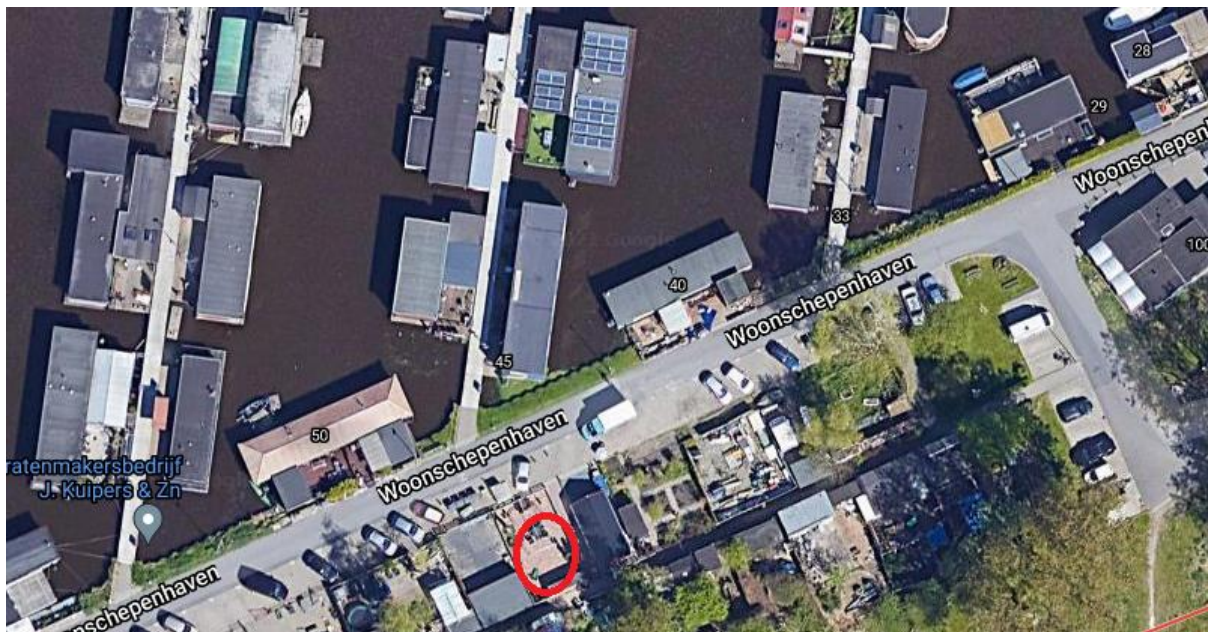
Figuur 2 Ter plekke van de rode cirkel is de projectlocatie globaal weergegeven