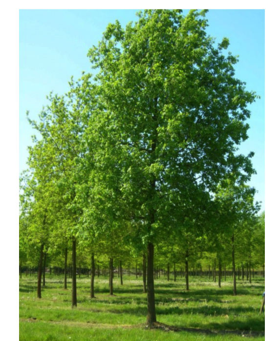
2 x nieuwe aanplant boom type: zomereik in de gezamenlijke buitenruimte

Op het verhoogde dek komen plantenbakken met een middelhoge beukenhaag (inheemse soort), ze dienen als privacy afscheiding. De overige groenstroken op het verhoogde dek zullen voorzien worden van vetplanten en kruidenmengsels met inheemse kruiden.