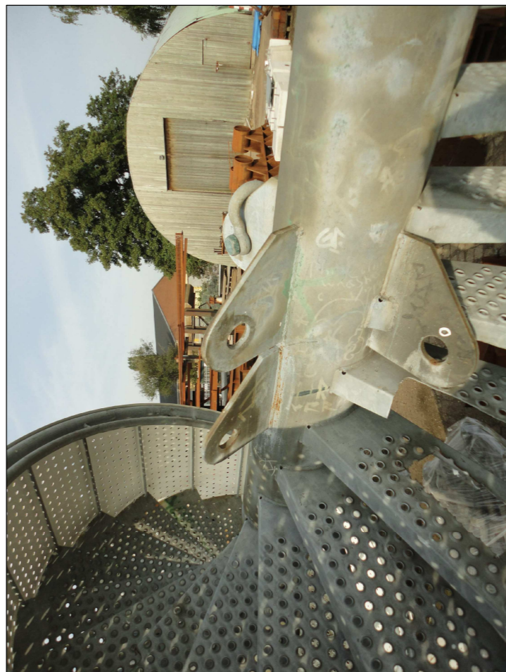
foto's huidige spilttrap 'Lapin'