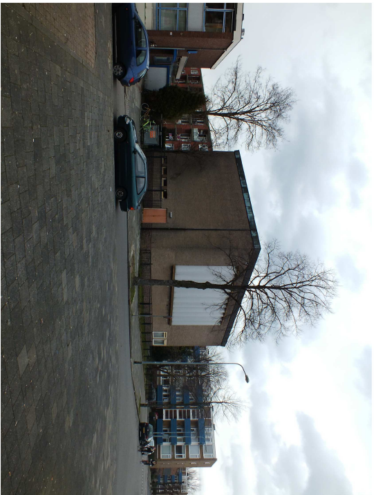
AANZICHT VAN SCHENDELSTRAAT