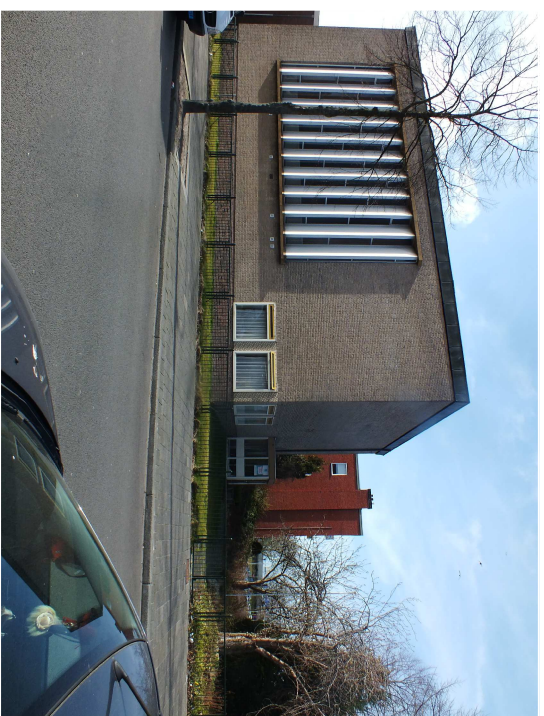
AANZICHT VAN SCHENDELSTRAAT