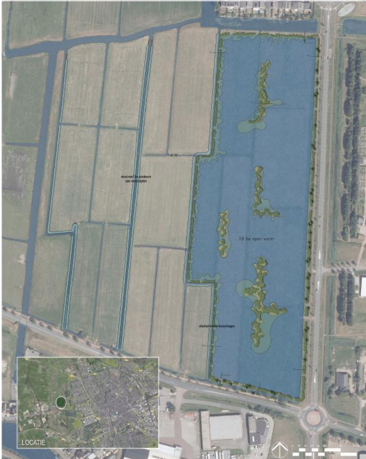
Figuur 4 Ontwerp van het tweede deel van de compensatieopgave ten westen van het Westpark buiten het plangebied van de Suikerzijde.

In overleg met alle externe deskundigen en met de provincie is inmiddels een inrichtingsschets gemaakt, waarbij zowel de compensatieopgave ingevuld wordt alsmede zoveel mogelijk rekening