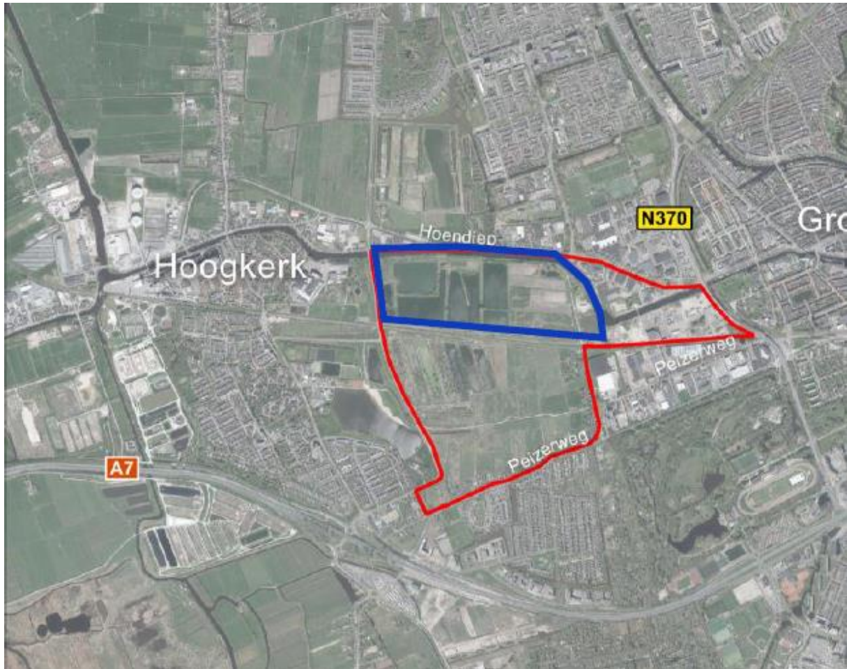
Figuur 1 In rood de globale begrenzing van het project De Suikerzijde. In blauw de globale begrenzing van deelgebied noord.

Voor de woningbouwopgave in de stad Groningen zullen onder meer woningen worden gerealiseerd op het voormalig terrein van de Suikerfabriek. Het gehele plangebied van het project 'De Suikerzijde' is circa 165 ha groot. Hiervan zal in de komende jaren deelgebied noord, circa 57 ha, ontwikkeld worden. In Figuur 1 is het gehele plangebied en deelgebied noord weergegeven.