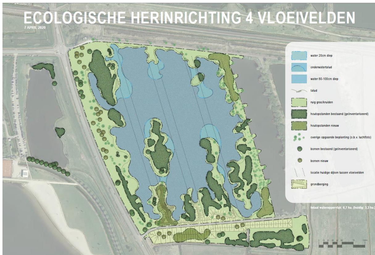
Figuur 2 Ontwerp van het eerste deel van de compensatieopgave ten zuiden van het spoor binnen het plangebied van de Suikerzijde.