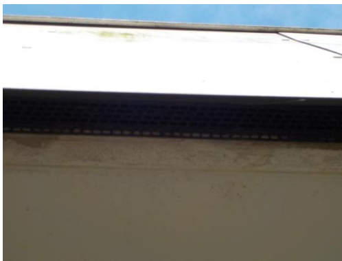
Foto 2 De kieren tussen de muur en de boeidelen zijn afgewerkt met roostertjes en daardoor ontoegankelijk voor vleermuizen.

De aanwezigheid van verblijfplaatsen van vleermuizen kan op basis van de quickscan worden uitgesloten. Het gebouw is ongeschikt voor vleermuizen om er een verblijfplaats te hebben. Het gebouw heeft weliswaar een spouw, maar deze is niet toegankelijk voor vleermuizen. Ook de ruimte achter de boeidelen zijn ontoegankelijk, doordat openingen zijn afgewerkt met roostertjes (zie foto 2).