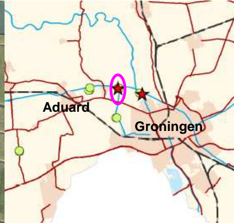
Figuur 6: Uitsnede kaart onderzoek naar Poelkikker. Het plangebied valt binnen de roze cirkel waar in 2008 zowel waarnemingen (groene cirkel) van Poelkikker als voortplantingslocaties (rode asterisk) zijn vastgesteld.