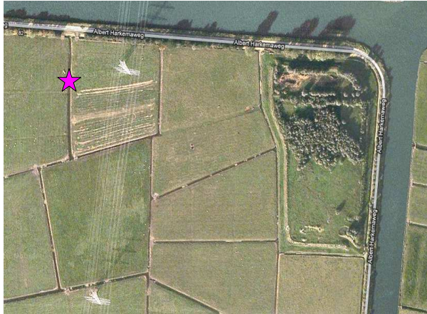
Figuur 5: Noordoosthoek plangebied (rechtsboven het slibdepot) met locatie van gevangen Poelkikker (roze asterisk).