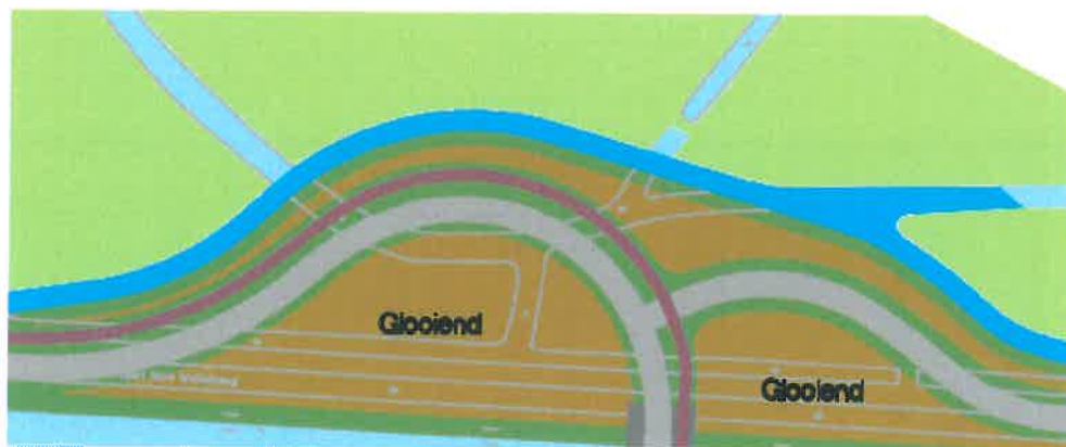
Aansluiting weg bij Aduard

De wijziging van deze weg zijn op de hierna volgende kaartjes aangegeven.