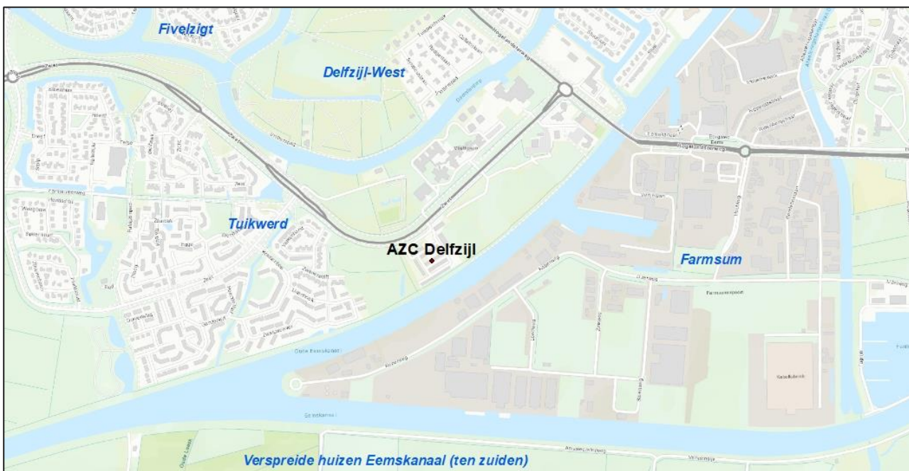
Figuur 1: Overzichtskartaal

In de nabijheid van het AZC is aan de zuidoostzijde een gezoneerd bedrijventerrein gelegen. Het AZC is verder nog gelegen aan een doorgaande weg, de Zwet. Aan de zuidzijde van het AZC ligt het Oude Eemskanaal, scheepsvaartlawaai is echter niet nader onderzocht, mede doordat hier geen wet- en regelgeving voor is. In Figuur 1 is de ligging van het AZC weergegeven.