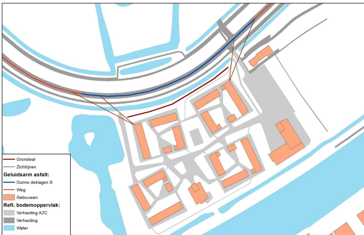
Figuur 5: Ligging van de maatregelvarianten

Ligging van de maatregelvarianten is weergegeven in onderstaande figuur.