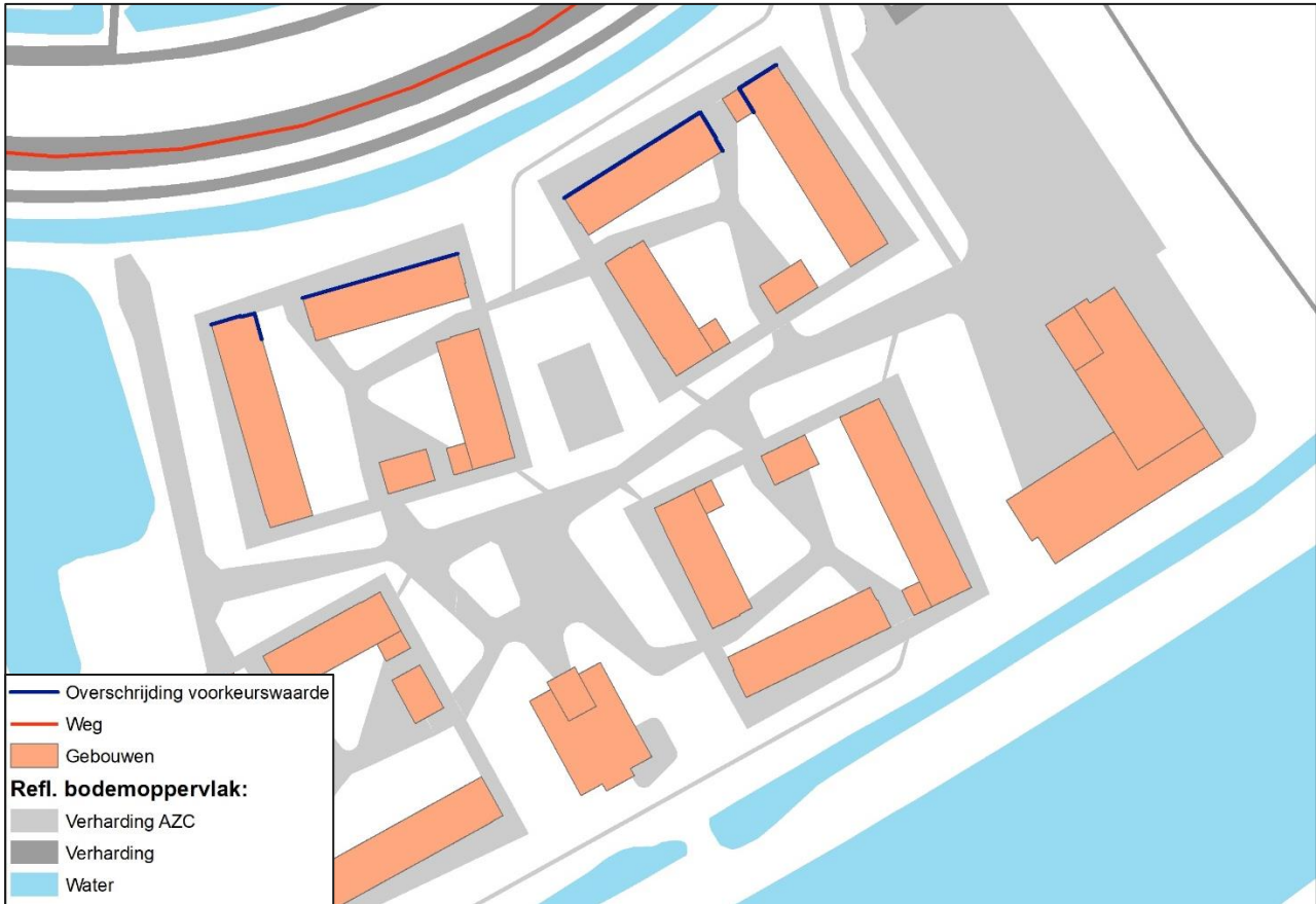
Figuur 4: Gevels met een overschrijding van de voorkeurswaarde

Omdat de voorkeurswaarde wordt overschreden is het effect en toepasbaarheid van maatregelen onderzocht. In hoofdstuk 5 is nader ingegaan op het maatregelen onderzoek.