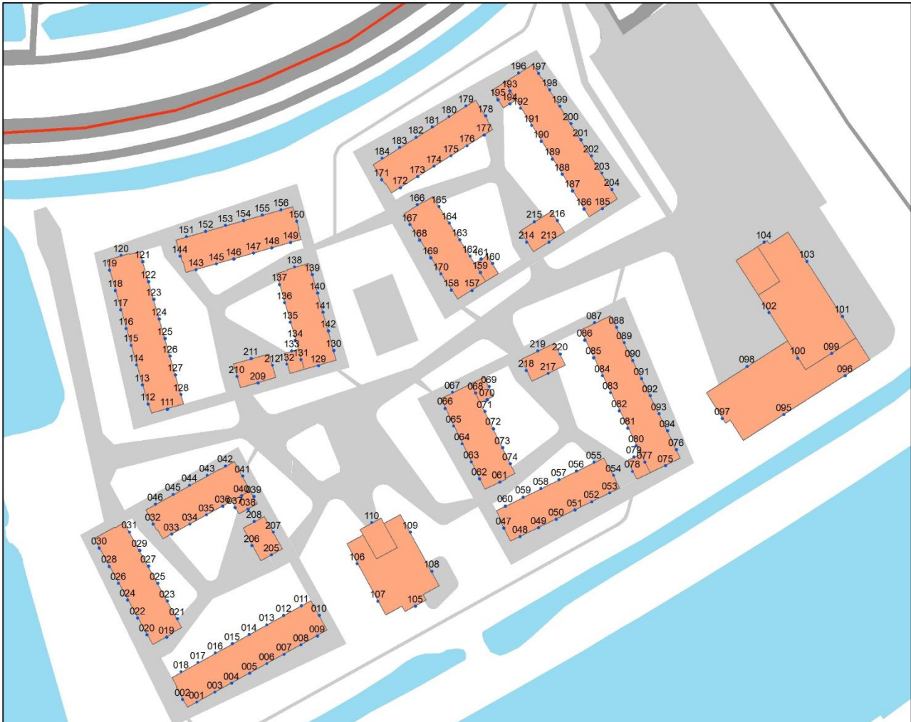
Figuur 3: Situering van de bebouwing en de ligging van de rekenpunten

De geluidsbelastingen ten gevolge van de Zwet en van het industrieterrein zijn berekend ter plaatse van de gevels van de geprojecteerde bestemmingen. De ligging van de geprojecteerde bestemmingen en de situering van de rekenpunten is weergegeven in Figuur 3.