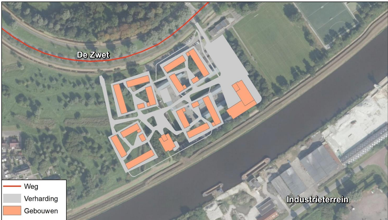
Figuur 2: Ontwerp nieuw AZC en de gezoneerde geluidbronnen

Het onderzoeksgebied wordt bepaald door de nieuwe bebouwing van het AZC. De bestemmingen zijn geprojecteerd in de wettelijke geluidszone van de Zwet en het gezoneerde industrieterrein aan de zuidzijde van het Oude Eemskanaal. Het ontwerp van de nieuwe AZC en de ligging van de gezoneerde geluidbronnen is weergegeven in Figuur 2.