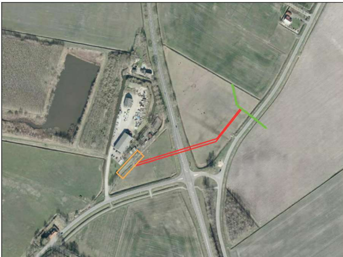
Figuur 2.1 Luchtfoto t.p.v. GOS Wagenborgen