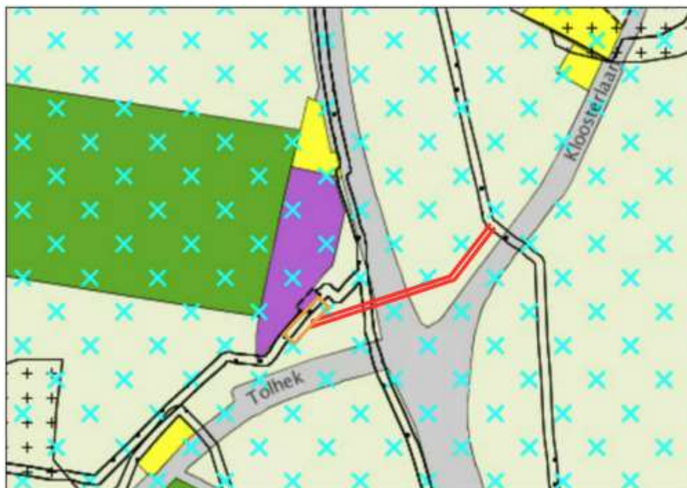
Figuur 1.2 Uitsnede verbeelding geldend bestemmingsplan

Het plangebied heeft op basis van het geldende bestemmingsplan de bestemmingen 'Agrarisch – Wegdorpenlandschap' en 'Verkeer'. Daarnaast is een beperkt deel van het plangebied voorzien van de dubbelbestemming 'Leiding – Gas'.