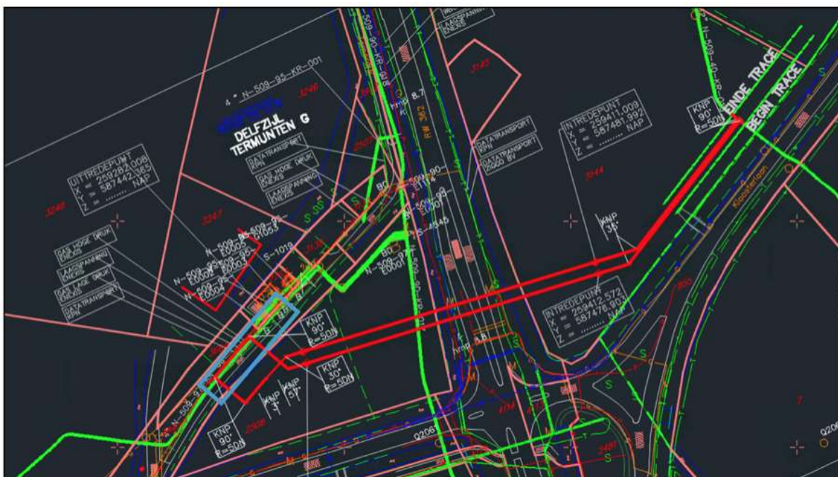
Figuur 2.2 Tekening t.p.v. GOS Wagenborgen