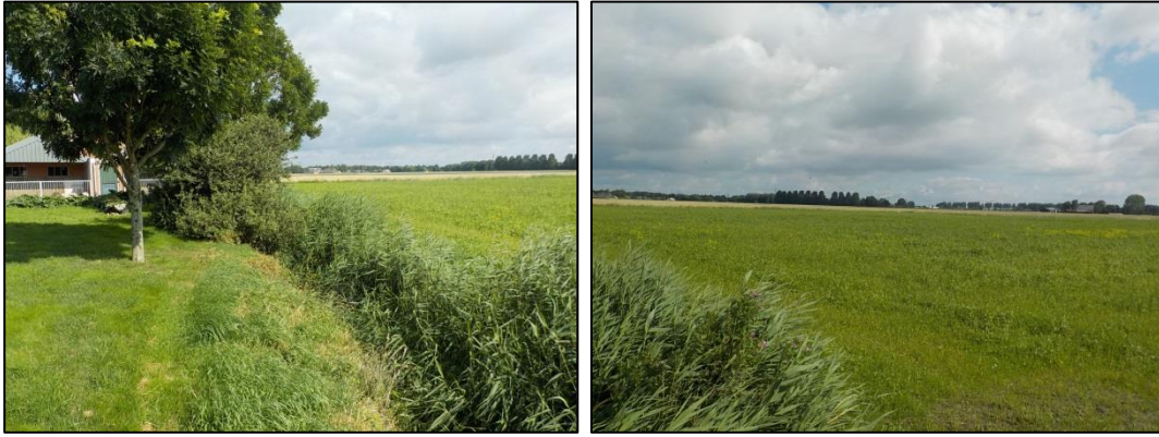
Foto 1 Impressie van het plangebied met links het te dempen slootdeel en de twee te kappen bomen, rechts het perceel waar de nieuwbouw plaatsvindt.