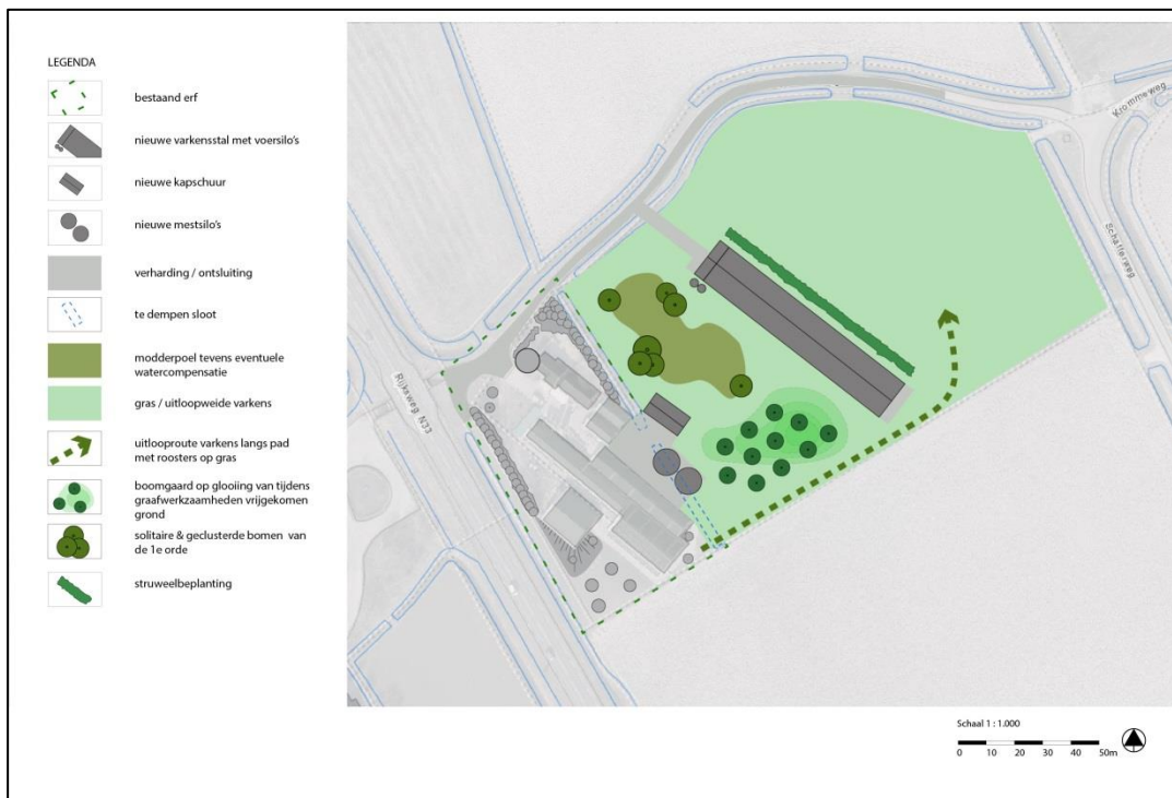
Figuur 2 Plan van voor uitbreiding van de varkensstal (bron: Agri-Matic B.V.).