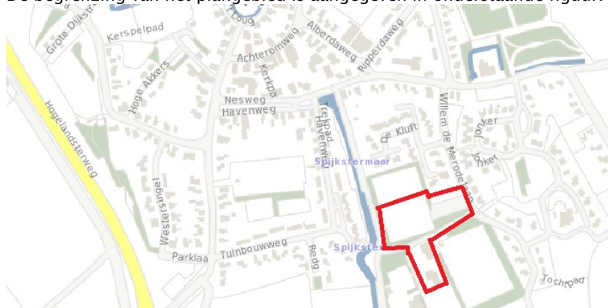
Figuur 1: Plangebied kindcentrum Spijk

De begrenzing van het plangebied is aangegeven in onderstaande figuur.