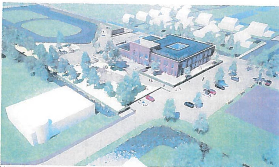
Vanuit het zuidoosten met rechts de heringerichte Riekele Prinsstraat

Onderstaande afbeeldingen geven het plan weer zoals het is tot nu toe is ontwikkeld.