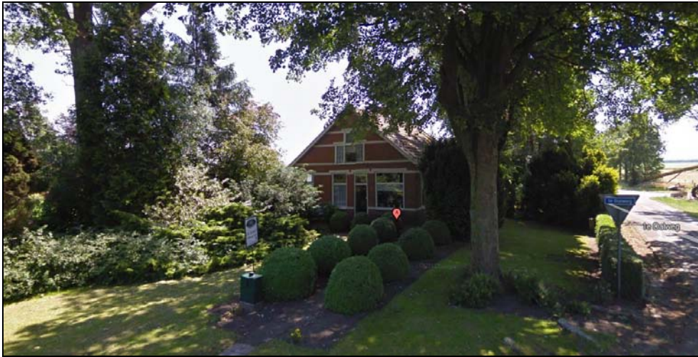
Figuur 2. Pand B.L.Tijdensweg 13 (n.b.: foto van vóór de verbouwing)

Het vrijstaande pand bevindt zich op een ruim perceel op de hoek van de B.L.Tijdensweg en de 1 ste Dalweg. De woning is gericht op het aangrenzende B.L.Tijdenskanaal en is gelegen op korte afstand van de dorpskerken Vriescheloo en Bellingwolde.