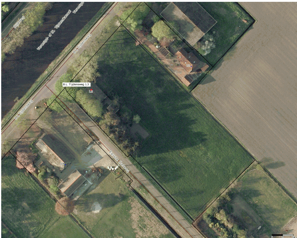
Figuur 1. Huidige situatie

Deze recreatieve functie krijgen door middel van dit bestemmingsplan een planologisch-juridische basis.