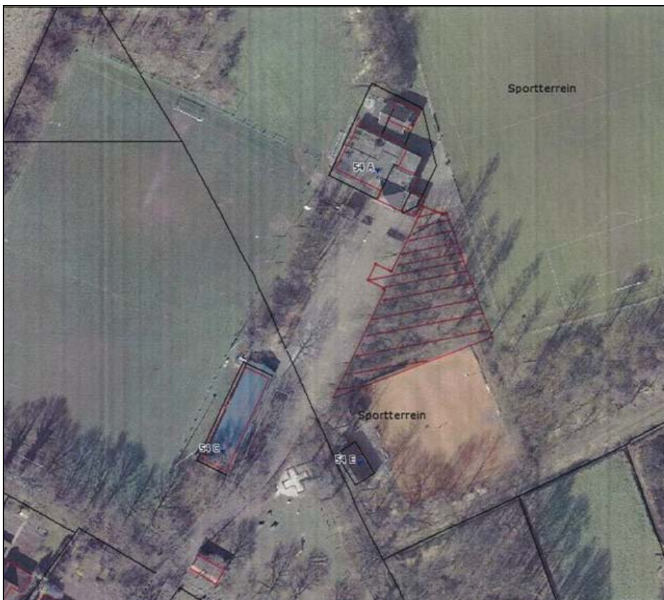
Figuur 1. Plangebied met omgeving (vastgoedviewer gemeente Bellingwedde)