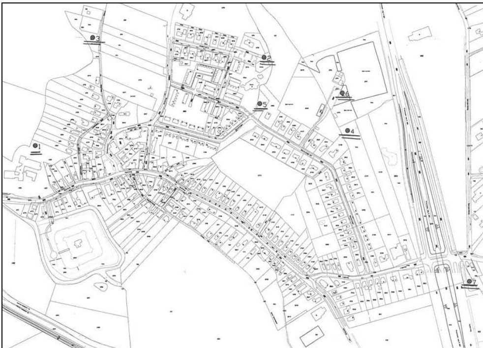
Figuur 2. Onderzochte locaties voor nieuwbouw jongerenonderkomen

Daarbij zijn een zevental locaties onderzocht die op onderstaande figuur zijn weergegeven. Al deze locaties bieden op zichzelf ruimte voor de voorziening. Tegelijk is gekeken naar het functioneren van deze locatie in relatie tot zijn omgeving.