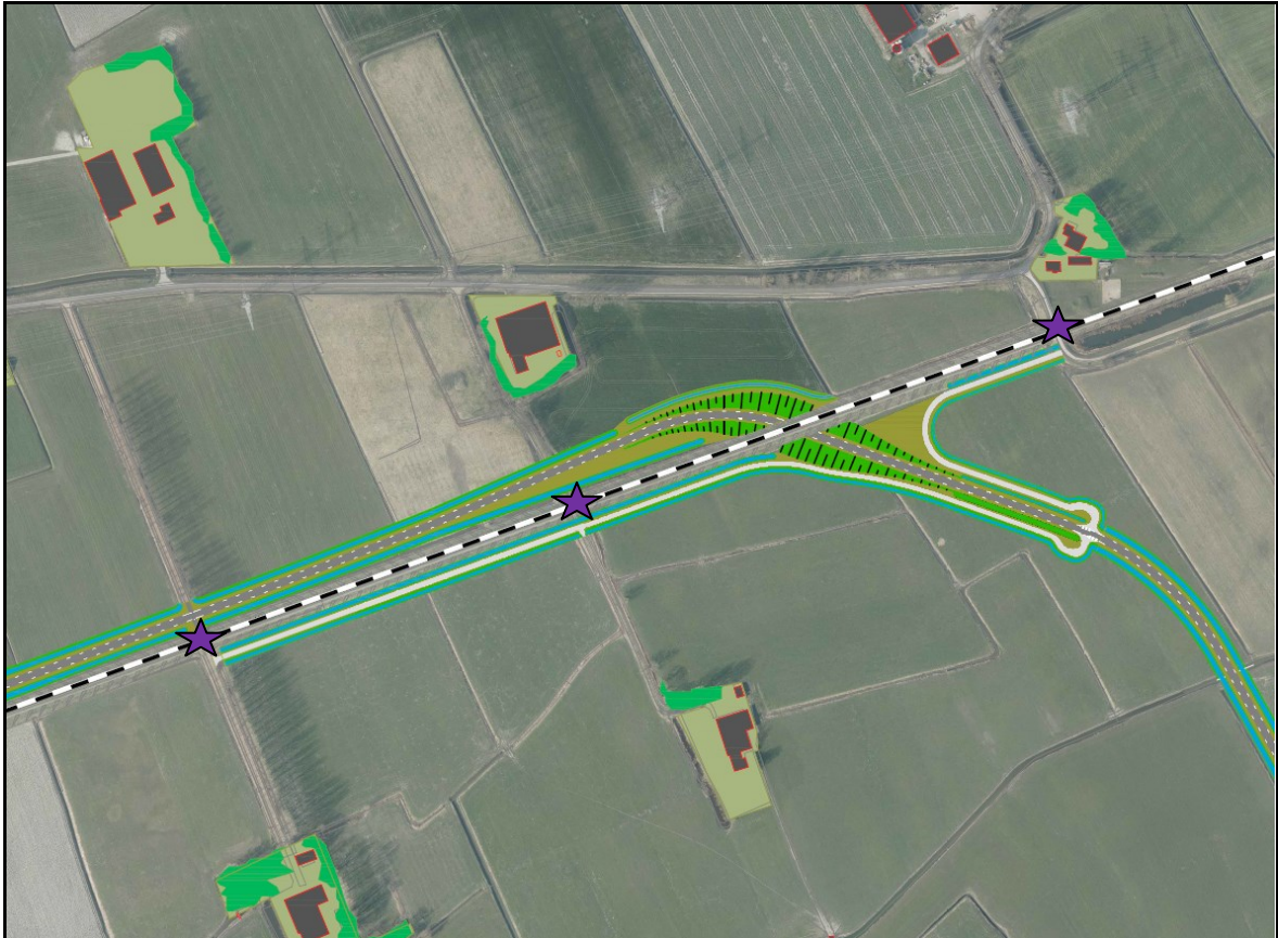
Overzichtstekening van de tunnel en de onbewaakte overgangen

Naast de eerder genoemde uitgangspunten voor de weg, zijn bij de uitwerking van de tunnelvariant de volgende uitgangspunten gehanteerd: