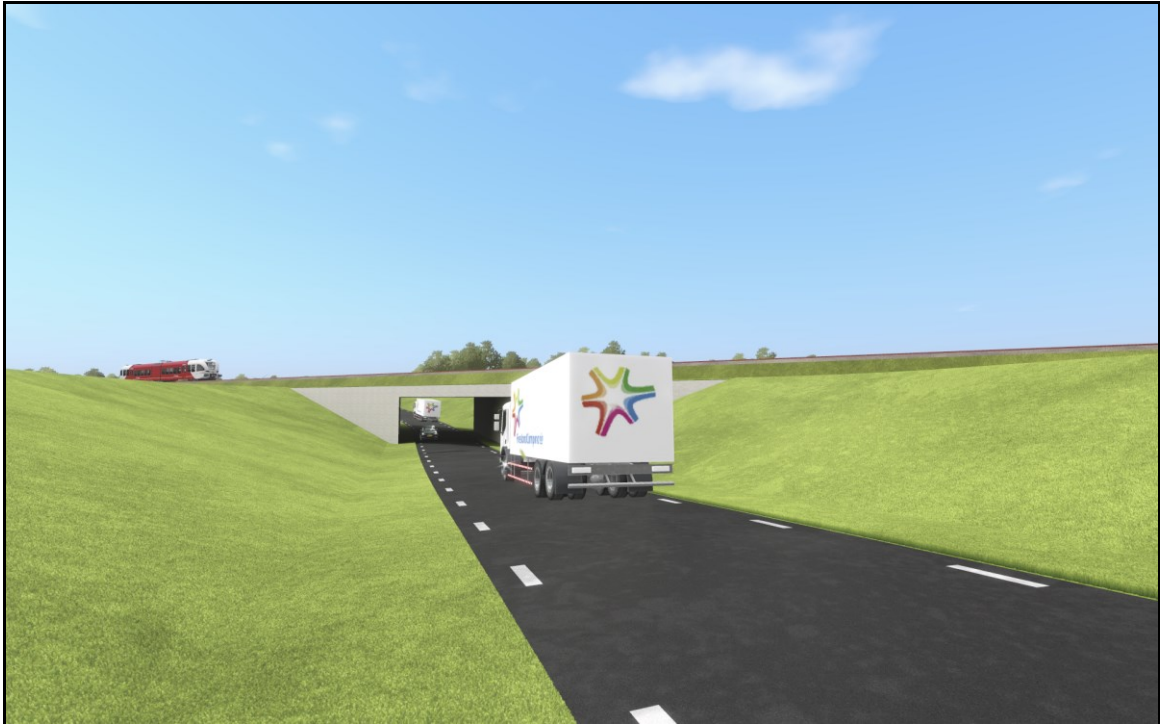
Impressie van de tunnel met groene taluds