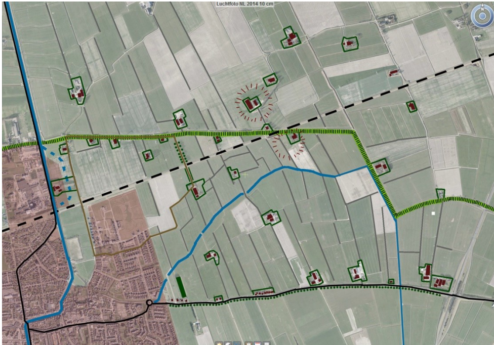
Beplanting versterkt de bestaande groenstructuren: de laanbeplanting langs de Sint Annerweg en de groene erfbeplanting van de boerderijen.

De laanbeplanting van de oprijlaan naar Ter Laan 27 wordt indien mogelijk en wenselijk versterkt