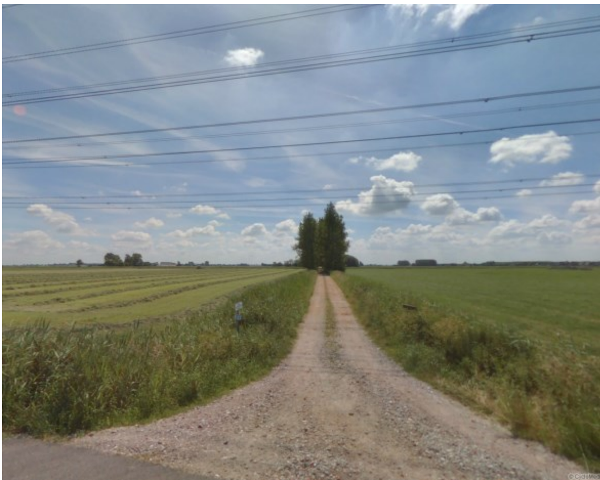
Laanbeplanting naar boerderij Ter Laan 27, gezien vanaf de Wolddijk