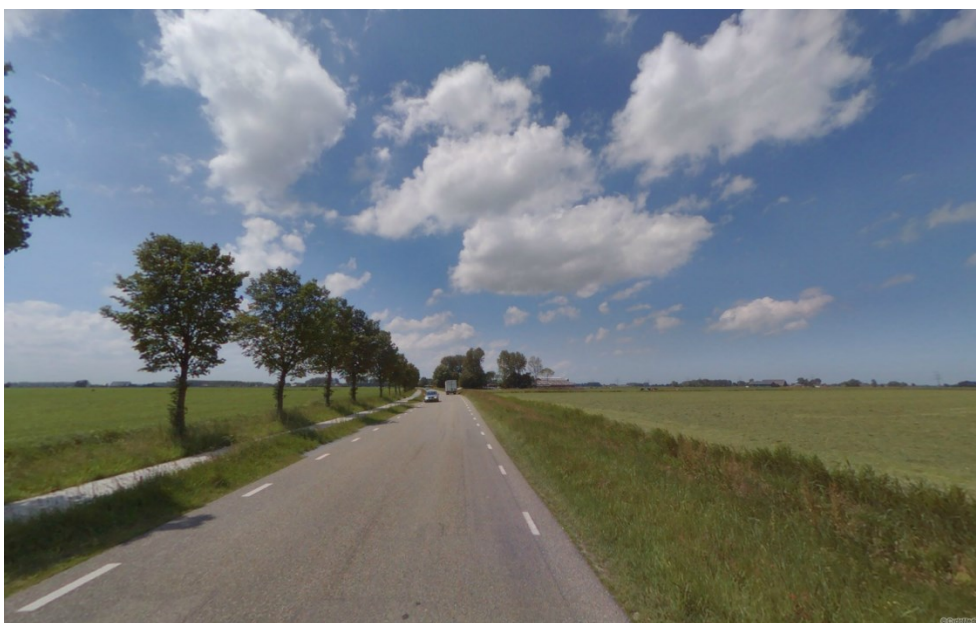
Laanbeplanting aan de zuidzijde van de Sint Annerweg