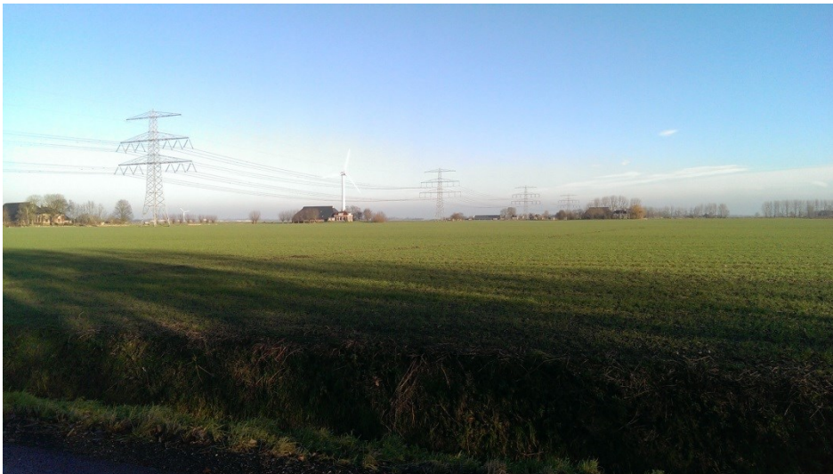
Zicht op de Wolddijk met aangelegene boerderijen

Het gebied waar de ontsluitingsweg zal komen is met een cirkel aangegeven op de kwaliteitskaart. De Wolddijk ligt op de overgang van het wierdenlandschap met het lager gelegen gebied centraal in Groningen.