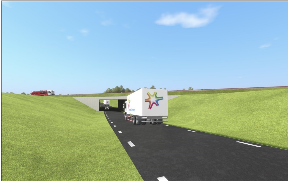
Impressie van de spoortunnel

De spoorwegtunnel mag schuin vormgegeven worden, dit geeft de mogelijkheid om de ontsluitingsweg zo min mogelijk te laten uitbuigen.