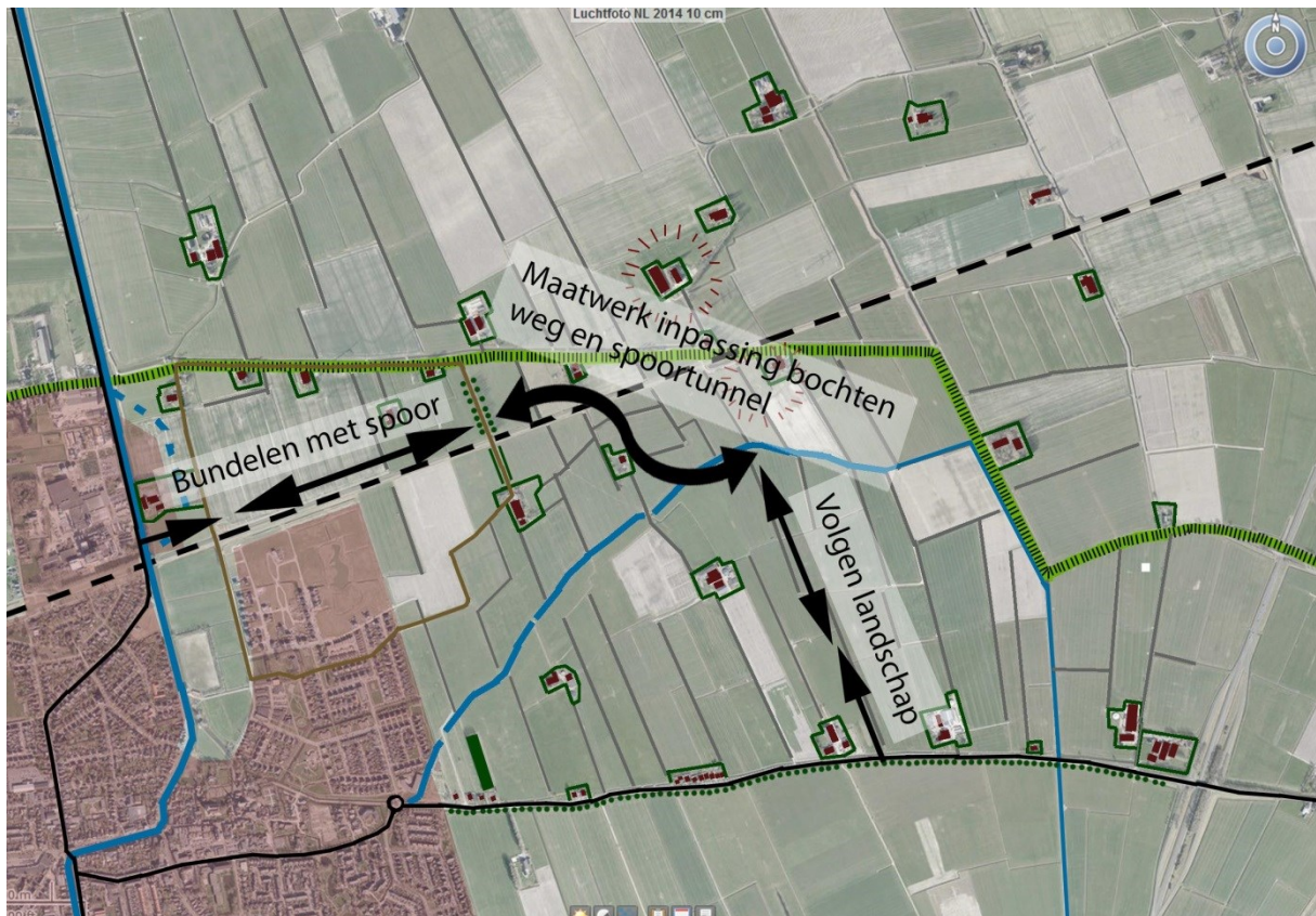
Ruimtelijk concept ontsluitingsweg Bedum