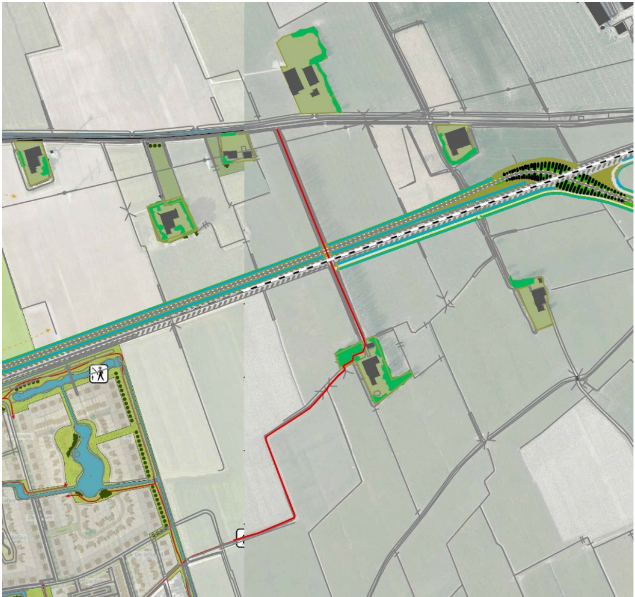
Inpassing van ontsluitingsweg bij 7-bruggetjespad.