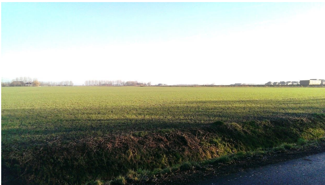
Zicht op het gebied waar de ontsluitingsweg zal komen tussen spoor en Wolddijk.