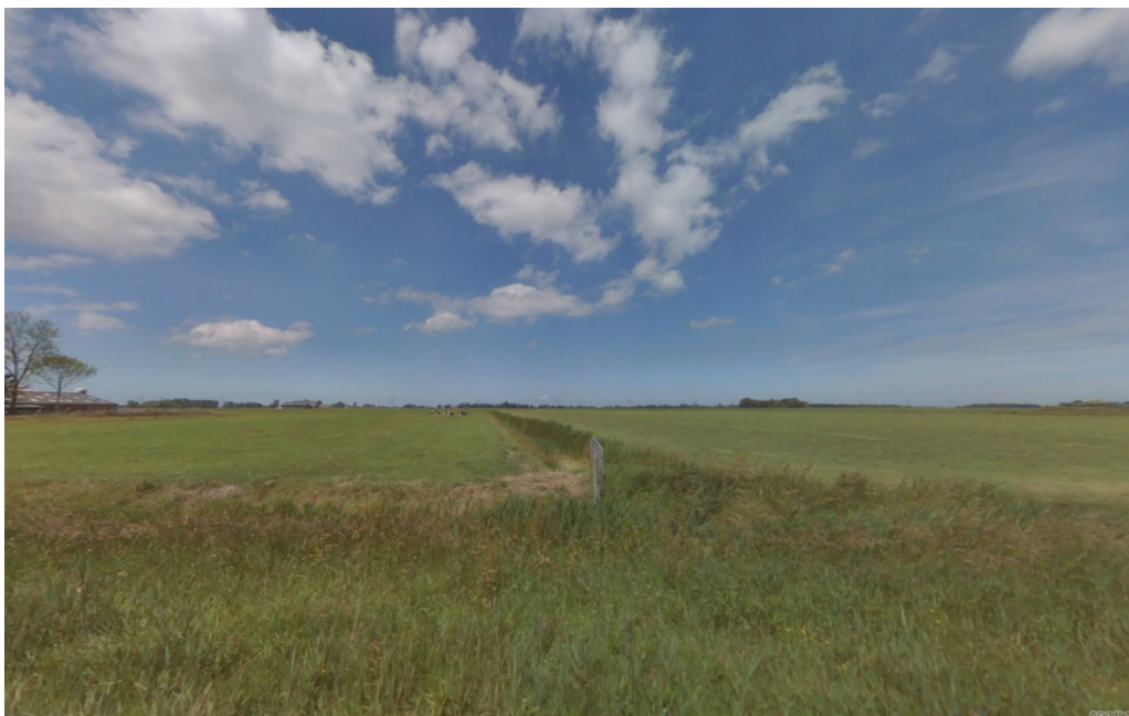
Zicht op het gebied waar de ontsluitingsweg zal komen, gezien vanaf de Sint Annerweg.

Het landschap kenmerkt zich door een grote maat en schaal en een grote mate van openheid. Het Boterdiep, de Wolddijk met daaraan gekoppelde boerderijen, de natuurlijke Laanstermaar, de Sint Annerweg en de verkaveling bepalen de hoofdstructuur van het landschap. Beplanting is met name aanwezig rondom de erven, een enkele oprijlaan en de laanstructuur langs de Sint Annerweg. Een groot deel van de vroegere erven is nu nog steeds herkenbaar aanwezig. In het plangebied zijn een tweetal wierden bekend. Deze karakteristieken zijn medebepalend geweest voor de keuze van het tracé en zijn mede-sturend voor de inrichting/inpassing van de weg