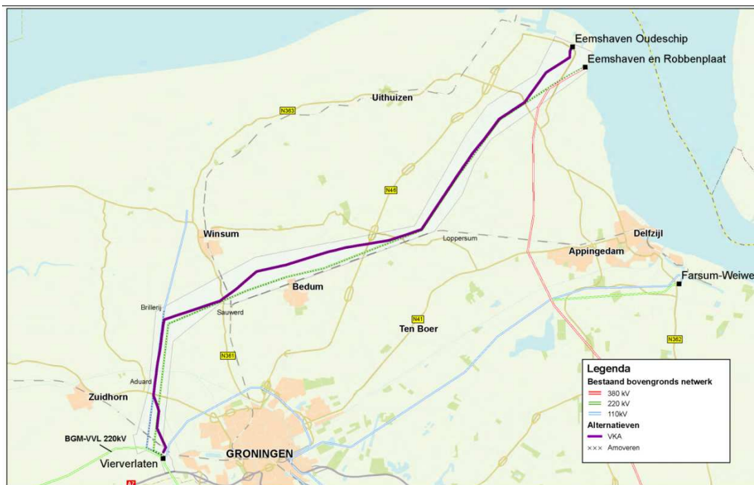
Figuur 1.1 Overzichtskartaal met de nieuw te bouwen 380 kV-hoogspanningsverbinding (voorkeustracé in paars) en de bestaande 110 en 220kV-verbindingen (blauw resp. groen).

De nieuwe verbinding loopt, evenals de oude, grotendeels door open landschap waarvan onderdelen belangrijke weidevogelgebieden zijn.