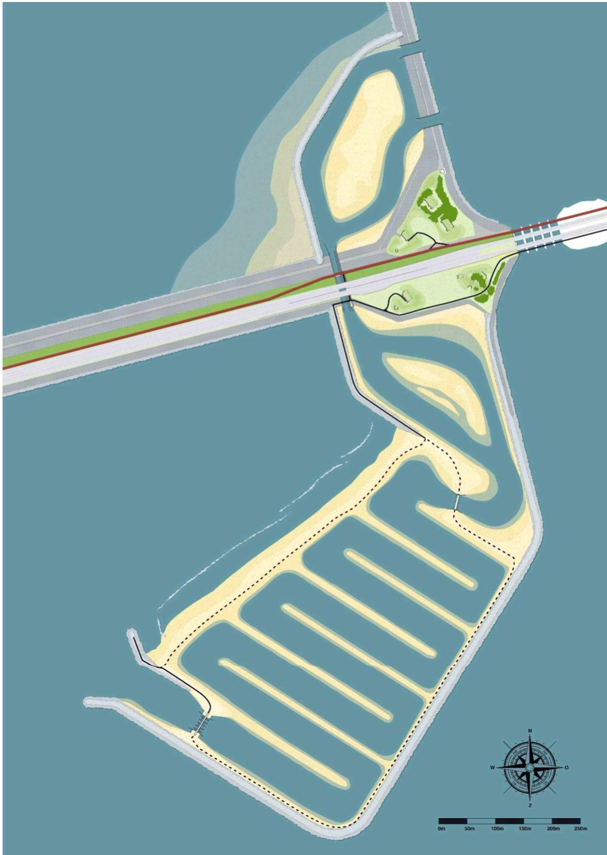
Figuur 1.2 Impressie vismigratierivier