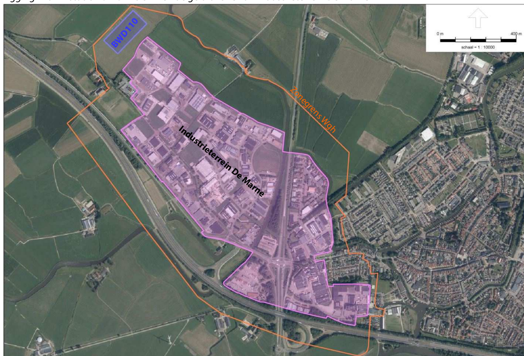
f2.1 Ligging 110 kV-station BWD110 binnen de geluidzone van industrieterrein De Marne

Het 110 kV-station is gelegen op een afstand van circa 320 meter ten noorden van de snelweg A7 en ruim 750 meter ten westen van de provinciale weg N359. Direct ten zuidoosten bevindt zich het gezoneerde industrieterrein. In de overige richtingen is sprake van hoofdzakelijk agrarisch gebied.