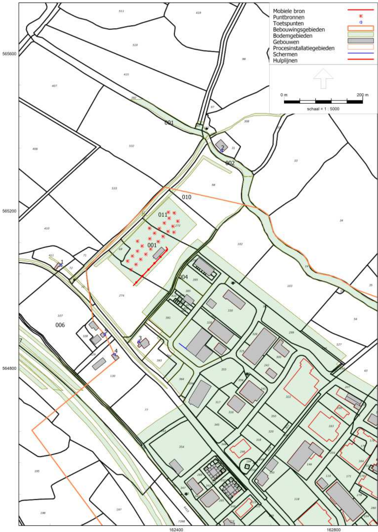
Figuur 1.1 Invoerplot rekenmodel - totaaloverzicht