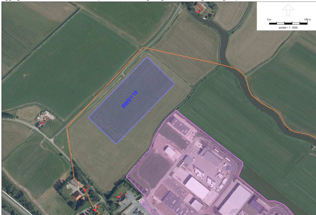
f2.2 Ligging 110 kV-station BWD110 ten opzichte van de omgeving en aanduiding woningen (posities 1 t/m 5)