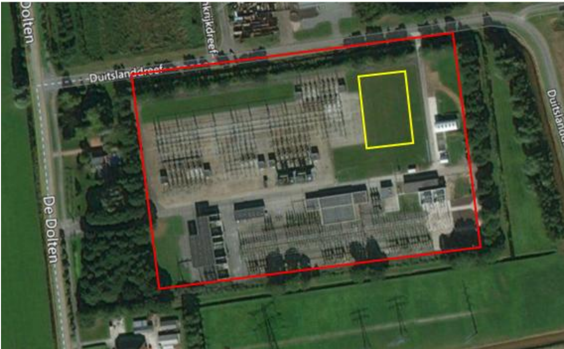
Figuur 2. Het transformatorstation in rood aangegeven. Het deel ten noord van de weg binnen het transformatorstation is in eigendom van Tennet. Het projectgebied waar de werkzaamheden van Tennet plaatsvinden in geel gearceerd