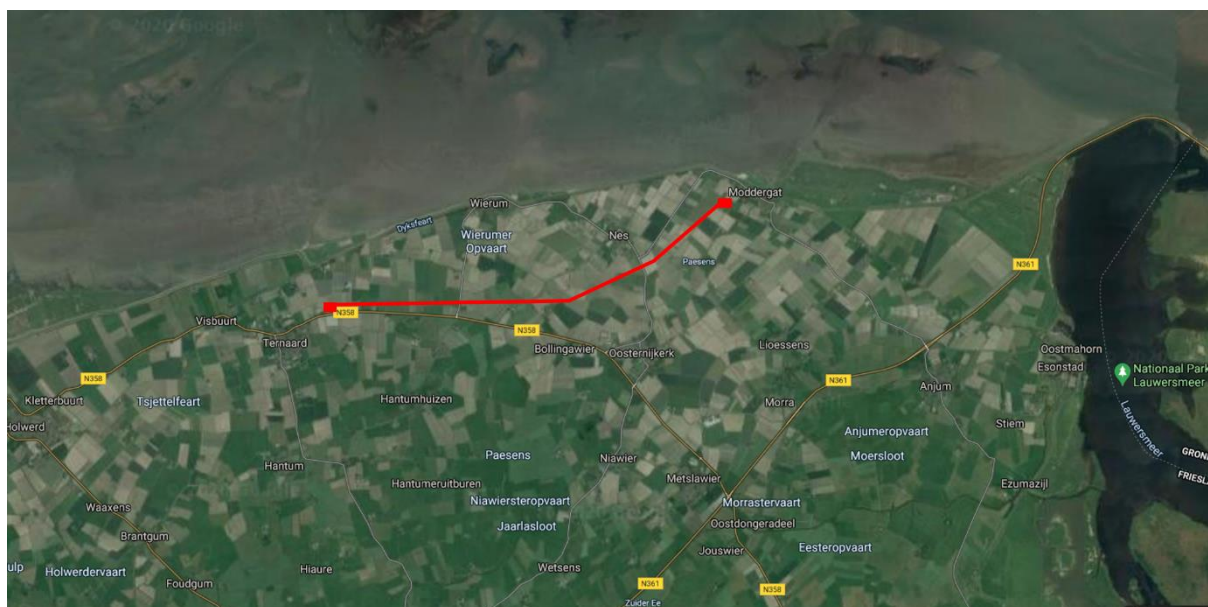
Figuur 1. Ligging plangebied

Het plangebied ligt tussen Ternaard en Moddergat in de gemeente Noardeast-Fryslân (Figuur 1). De omgeving van het plangebied bestaat uit akkerlanden, afgewisseld met graslanden en watergangen. De watergangen betreffen landbouwsloten. Het tracé kruist twee grotere watergangen, de Wierumer Opvaart en de Paezens, beide brede landbouwsloten met rietbegroeide steile oevers. Figuur 2 geeft een impressie van het plangebied.