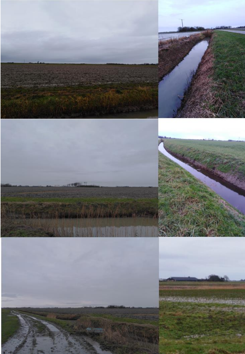
Figuur 2. Impressie plangebied en omgeving