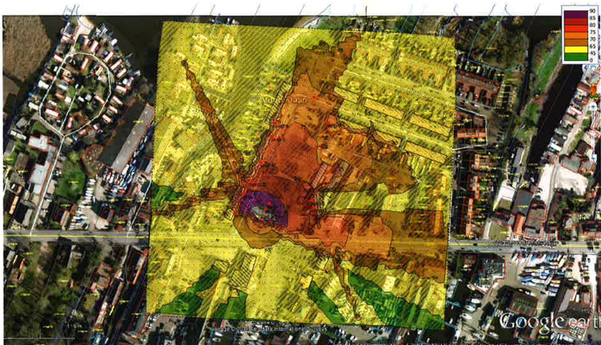
Figuur 1 – Vuntusplein

Bovenstaande figuur 1 geeft de situatie weer met als uitgangspunt een geluidsniveau van circa 90 dB op 15 meter van podium. Dit betekent op dit plein dus een geluidsniveau van circa 72 tot 85 dB(A) bij de woningen rondom.