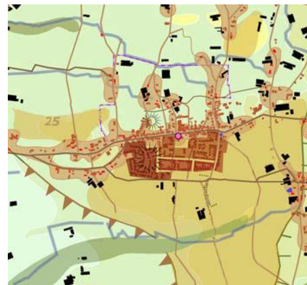
Verstedelijking na 1955 (bruin) en varkenshouderijen (zwart)