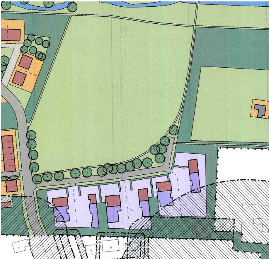
Brink en bebouwing